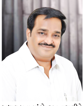
અધ્યક્ષના વ્યાજો છે. જીતુ વાઘાણીને બદલે સી.આર. પાટિલને ભાજપનાં નવા પ્રદેશ પ્રમુખ બનાવવામાં આવ્યાં છે. સીઆર પાટીલ અત્યારે નવસારીનાં સાંસદ

અમદાવાદ, તા. ૨૦ ગુજરાતમાં એક તરફ રાજ્યસભાની પેટા ચૂંટણીની તૈયારીઓનાં પડઘા સંભળાઈ રહ્યાં છે એવામાં ભાજપ-કોંગ્રેસ વચ્ચે તોડ-જોડની રાજનીતિ ચાલી રહી છે. આ તમામ ઘટનાઓ વચ્ચે તાજેતરમાં જ ગુજરાત ભાજપનાં નવા પ્રદેશ પ્રમુખની વરણી કરવામાં આવી છે. સી.આર. પાટિલને ભાજપનાં નવા પ્રદેશ પ્રમુખ બનાવવામાં આવ્યાં છે. રાજ્યમાં ભાજપનાં નવા પ્રદેશ પ્રમુખને લઈને છેલ્લાં કેટલાંય સમયથી અનેક નામોની ચર્ચાઓ ચાલી રહી હતી. આખરે ભાજપે નવસારીનાં સાંસદ અને ભાજપનાં પીઠનેતા એવાં સી.આર. પાટીલનાં