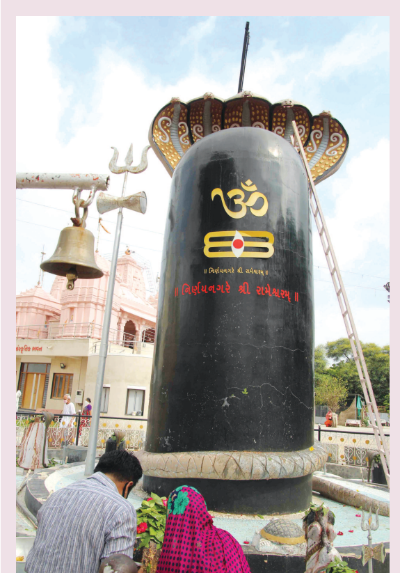
હરહર મહાદેવ - શ્રાવણના પ્રારંભે ભગવાન સદાશીવને પ્રાર્થિએ... કે, વૈશ્વિક મહામારીમાંથી મુક્ત કરી સૌને સ્વસ્થ જીવન આપો... પ્રાર્થિએ છીએ... 'તમો ભક્તોના ભય હરનારા, શુભ સૌનું સદા કરનારા... કષ્ટ કાપો...'

ગુજરાતના નવા પ્રદેશ પ્રમુખ તરીકે હરિ ચૌધરી, શંકર ચૌધરી, મનસુખ માંડવીયા, ભુપેન્દ્રસિંહ યુગસમા તો ઉત્તર ગુજરાતમાંથી કે.સી.પટેલનું નામ