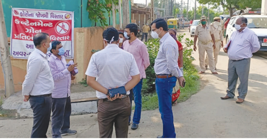
અરવલ્લી જિલ્લા કલેક્ટરે બાયડમાં આવેલ કન્ટેનમેન્ટ ઝોનની મુલાકાત લીધી હતી.

તથા ઈડરની કુંડુ ફળીમાં રહેતા ૪૫ વર્ષિય પુરુષ, ભાટીયા વાસમાં ૭૦ વર્ષિય વૃદ્ધ અને ૨૦ વર્ષિય યુવક કોરોના પોઝિટીવનો ભોગ બનતા આ તમામને સારવાર માટે ખસેડાયા છે. ઉલ્લેખનીય છે કે ગઈકાલે સાબરકાંઠા જિલ્લામાં કોરોના પોઝિટીવનો આંકડો ૩૩૨ હતો જે શુક્રવારે સાંજે પાંચ વાગે ૩૪૧ થઈ ગયો છે. જે પૈકી ૨૪૬ દર્દીઓને હોસ્પિટલમાંથી રજા અપાઈ છે અને હાલ ૮૮ કેસ એક્ટીવ છે. જિલ્લામાં સૌથી વધુ કોરોના પોઝિટીવના કેસ હિંમતનગરમાં ૧૫૪ જ્યારે પ્રાંતિજ તાલુકામાં ૭૨ છે.