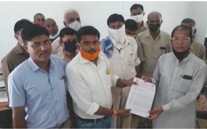
કર્મચારીઓએ મિલોડાના ધારાસભ્યને આવેદનપત્ર આપી છે. પ્રજાની સેવા માટે આવી છે. પ્રજાની સેવા માટે આવી છે. પ્રજાની સેવા માટે આવી છે.

માટે એસ.ટી. બસો ચાલુ રાખવામાં આવે તેવી માંગણી છે. એસ.ટી. નિગમ દ્વારા નહીં નફો નહીં નુકશાનના ધોરણે રાજ્યની પ્રજાને બસ સેવાનો લાભ આપવામાં આવે છે. પરંતુ કેટલાક સમયથી એસ.ટી.નું ખાનગીકરણ કરવામાં આવી રહ્યું હોય તેવી ગતિવિધીઓ શરૂ કરાઈ છે. કોરોના મહામારીના સમયે પણ નિગમના કર્મચારીઓ પોતાને કે પોતાના પરિવારની ચિંતા કર્યા વગર રાત-દિવસ ફરજ બજાવી રહ્યા છે. ત્યારે પ્રજાના હિતમાં એસ.ટી. નિગમનું ખાનગીકરણ ન કરાય અને કર્મચારીઓના પડતર પ્રશ્નોનો ઝડપથી નિરાકરણ કરવામાં આવે તેવી માંગણી સાથે ધારાસભ્ય ડૉ.અનિલ જોષીયારાને આવેદનપત્ર આપી રજૂઆત કરાઈ હતી.