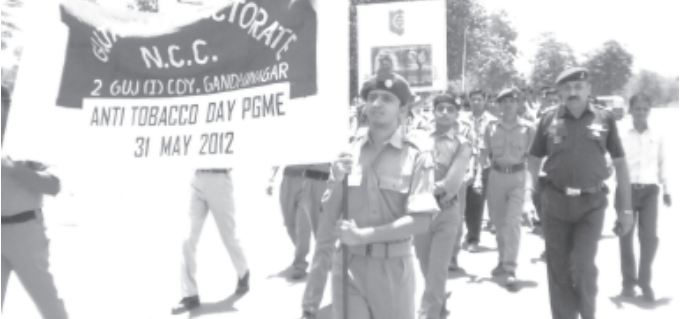
વિશ્વ તમાકુ દિન નિમિત્તે ગાંધીનગર એન.સી.સી. ઓફિસર કમાન્ડિંગ સિંધે દ્વારા ગાંધીનગરમાં તમાકુના વ્યસનની જાગૃતિ માટે રેલી યોજાઈ હતી. જેમાં ૪૮૯ જેટલા વિદ્યાર્થીઓ જોડાયા હતા. ગાંધીનગર એન.સી.સી. કમાન્ડિંગ ઓફિસર સિંધે લીલી ઝંડી આપી સમગ્ર રેલીને પ્રસ્થાન કરાવ્યું હતું. યુવાનો તમાકુ જેવા વ્યસનથી દૂર રહે અને સ્વાસ્થ્ય પ્રત્યે જાગૃતિ કેળવે તે નિમિત્તે એન.સી.સી. દ્વારા તમાકુ વિરોધી રેલી યોજાઈ હતી.

સેક્ટરથી પણ ઓછા સમયમાં પ્રતિસાદ પામેલા છે. ઇમરજન્સી મેનેજમેન્ટ સેન્ટરના વહીવટી કુશળ કર્મચારીઓને એવી તાલીમ અને વાતાવરણ પુર પાડેલ છે કે જેનાથી ઇમરજન્સીને હેન્ડલ કરવાના માર્ગમાં તેમનો માનસિક તણાવનું સ્તર અને સેવાની ગુણવત્તા જાળવી શકાય છે. ૧૦૮ની ટીમે હમણાં જ અમુખ ટીબળ અને નિંદાત્મક કોલ્સ કરનારને ઓળખી કાઢ્યા છે કે જેમણે ૧૦૦૦થી ૧૫૦૦ વખત, એક જ માસમાં, જાનંતી બચાવતો આંબર પર ફોન કરેલાં છે. આવા ઉપદ્રવકારક, અપમાનજનક અને નિંદાત્મક ફોન કોલ્સ, ભવિષ્ય અસરકારક કોલ્સનાં પ્રકારમાં સમાવિષ્ટ થાય છે કે જે સીધે સીધું બિનઉપાદેશક કામનું ભારણ વધારે છે અને કર્મચારીઓનાં કિંમતી સમયને પણ નુકશાન પહોંચાડે છે, તેથી વધુ કોઈ પણ ઇમરજન્સીને હેન્ડલ કરવાના માર્ગમાં આડું આવે છે.