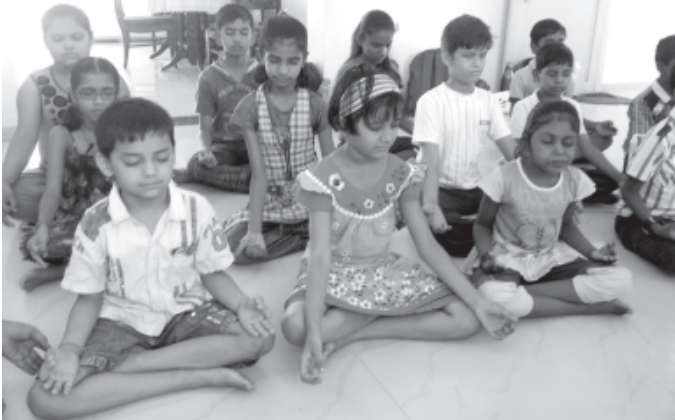
ગાંધીનગર, તા. ૩૧ ઉદ્ગમ યેરીટેબલ ટ્રસ્ટ દ્વારા આયોજિત બાળવૈભવ સમર કંપ્સ સંપન્ન થયો છે, જેની ફળશ્રુતિરૂપે બાળકોના વિકાસ અર્થે દર માસે એકવાર બેઠક યોજવાનો નિર્ણય વાલીઓ દ્વારા કરવામાં આવ્યો છે.