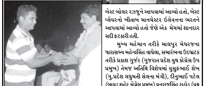
આ શાનદાર ફાઈનલ મહાસંગ્રામ નિહાળવા બાયડ પોલીસ સ્ટેશન ગ્રાઉન્ડ ઉપર લગભગ ૫૦૦૦ હજાર જેટલી વ્યાજ જનમેદની ઉપસ્થિત રહી હતી. આ ફાઈનલ મેચમાં આયોજકો દ્વારા ધમાકેદાર આતીશબાજી કરવામાં આવી હતી. જ્યારે રોકસ્ટર ડી.જે. સાઉન્ડના તાલે પ્રેક્ષકો જુમી ઉઠયા હતા. આ

બેસ્ટ બોલર રઝજુને આપવામાં આવ્યો હતો, બેસ્ટ પ્લેયરનો ખીતાબ માનચેસ્ટર ઈલેવનના ભરતને આપવામાં આવ્યો હતો જેણે એક મેચમાં શાનદાર સદી ફટકારી હતી.