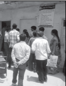
મચી ગઈ હતી.

સહિત ફર્નિચર પણ બહાર ફેંકી દેતા અફરાતફરી મચી ગઈ હતી. મહિલાઓનો મિજાજ જોતા નગરસેવકો સહિત કર્મચારીઓ પણ ભાગી છૂટયા હતા. જોકે, પીડિત મહિલાઓએ લડાયક મિજાજનો પરિચય આપતા પોલીસ કેસ કરવાની ધમકીને