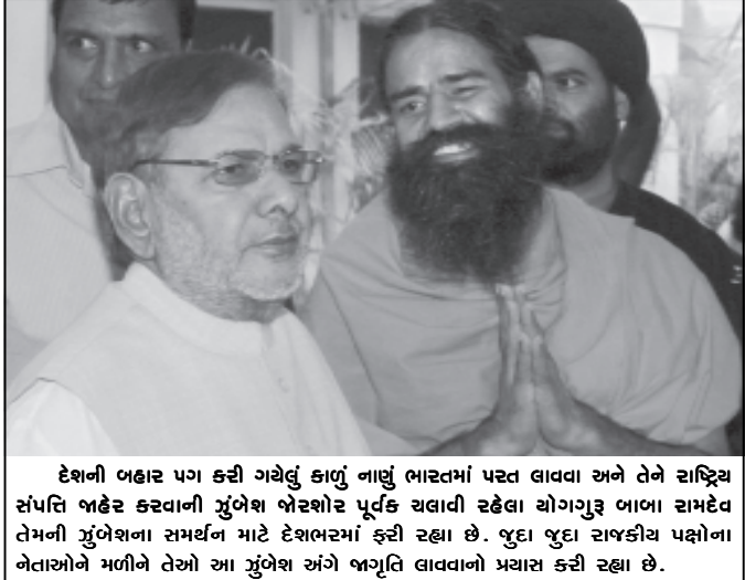
દેશની બહાર પગ કરી ગયેલું કાળું નાણું ભારતમાં પરત લાવવા અને તેને રાષ્ટ્રિય સંપત્તિ બહેર કરવાની ઝુંબેશ બેરબોર પૂર્વક ચલાવી રહેલા મોગનુર બાબા સમર્થન તેમની ઝુંબેશના સમર્થન માટે દેશભરમાં ફરી રહ્યા છે. જુદા જુદા રાજકીય પક્ષોના નેતાઓને મળીને તેઓ આ ઝુંબેશ અંગે જાગૃતિ લાવવાનો પ્રયાસ કરી રહ્યા છે.

વાળા નિવેદન બદલ માફીની માંગણી પણ કરવામાં આવી હતી. સંરક્ષણ મંત્રાલયે કાયદાકીય નોટિસ ફટકારવા બીઈએમએલના વડાને પરવાગી આપી હોવાનો ઈન્કાર કર્યો હતો. ૩૧મી મેના દિવસે નિવૃત્ત થયેલા જનરલ સિંહે આક્ષેપ કર્યો હતો કે એક ભૂતપૂર્વ અધિકાર દ્વારા તેઓને ૧૪ કરોડની લાંચની ઓફર કરાઈ હતી.