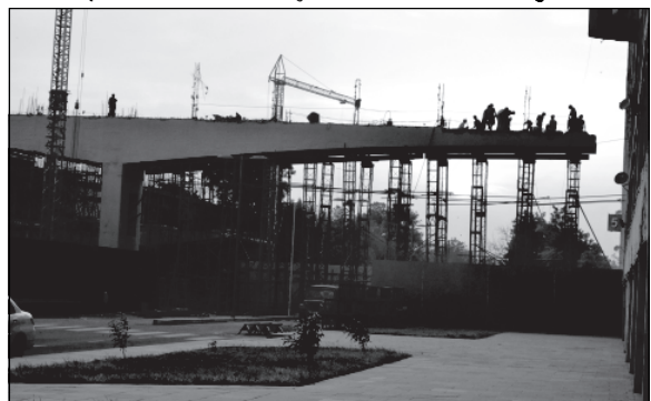
ગાંધીનગર શહેરના સીવી મોટા વહીવટીય સંકુલ સચિવાલય અને વિધાનસભાને જોડતો બ્રીજ બે દાયકા સુધી ઈજનેરી કૌશલ્યનું આગવું આકર્ષક બની રહ્યો હતો અને આ બ્રીજ તોડવામાં આવી રહ્યો છે. ચાર-ચાર મજલાના બે નવા મીની બ્લોક બનાવવાની પુરજોશમાં ચાલી રહેલી કામગીરીને પગલે આ બ્રીજ તોડવામાં આવી રહ્યો છે. આ બે મીની બ્લોક ડિસેમ્બર-૨૦૧૨ સુધીમાં તૈયાર કરી દેવામાં આવનાર છે. દિવસ રાત અહિં નિર્માણ કામ ચાલી રહ્યું છે. વિધાનસભા અને સચિવાલય સંકુલને જોડતો આ બ્રીજ વિધાનસભાનું સત્ર ચાલુ હોય ત્યારે જ ખોલવામાં આવતો હતો પરંતુ તેમાં આ પછી સુરક્ષા મુદ્દે તેના પરથી અવર જવાવ સંદર્ભ બંધ કરી દેવામાં આવી હતી. ૧૯૮૫ના સમયગાળામાં આ બ્રીજનું નિર્માણ કાર્ય હાથ ધરવામાં આવ્યું હતું. આ બ્રીજને તોડવા માટે આધુનિક ટેકનોલોજીનો ઉપયોગ કરવામાં આવી રહ્યો છે. તેમજ સચિવાલયનો એક માત્ર પણ બંધ કરવામાં આવ્યો છે.