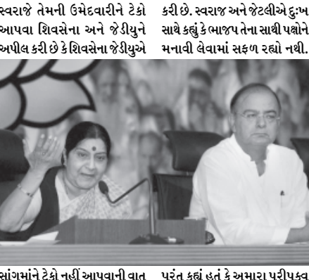
સાંગમાંને ટેકો નહીં આપવાની વાત પરંતુ કહ્યું હતું કે અમારા પરીપકવ

કોઈ ચર્ચા કરવામાં આવી નથી. જેથી વિરોધ પક્ષ વોકઓવરની મંજૂરી આપશે. પત્રકાર પરિષદમાં આ નિર્ણયની જાહેરાત કરતા ભાજપના નેતા સુખ્મા સ્વરાજ અને અરૂણ જેટલીએ કહ્યું હતું મુખ્ય વિરોધ પક્ષ સરકારને ટેકો આપશે નહીં. સરકાર સત્તામાં રહેવા જુદા જુદા પક્ષોને રોકવાની ઈચ્છા ધરાવે છે. સુખ્મા સ્વરાજે કહ્યું હતું કે ભાજપે સાંગમાંની ઉમેદવારીને ટેકો આપવાનો નિર્ણય કર્યો છે. સાંગમાંની ઉમેદવારીને અત્રા દ્રમુક અને બીજાંએ પણ ટેકો આપ્યો છે. સાંગમાંને દેશના સૌથી સર્વોચ્ચ નેતા તરીકે જણાવીને સુખ્મા