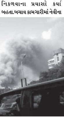
લેવિકોષ્ટરની પણ મદદ લેવામાં આવી હતી. દાહ ગયેલા ૧૧ લોકોને હોસ્પિટલમાં દાખલ