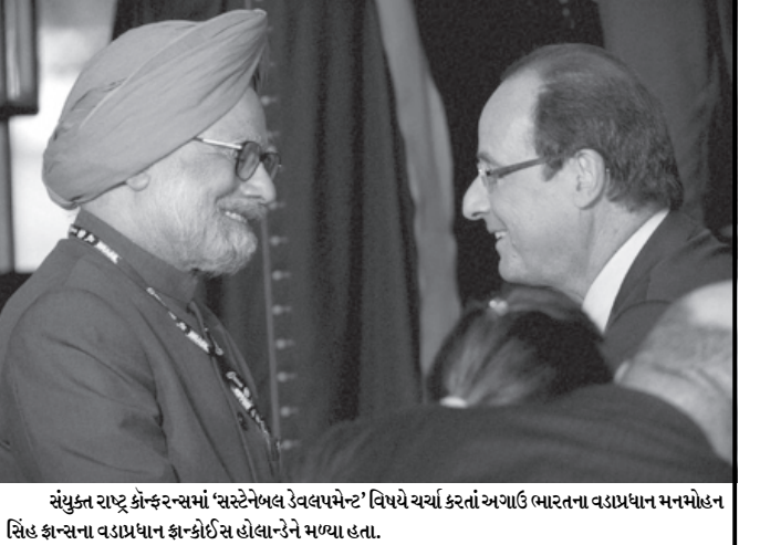
સંયુક્ત રાષ્ટ્ર કોન્ફરન્સમાં 'સરટેનેબલ રેવલપમેન્ટ' વિષયે ચર્ચા કરતાં અગાઉ ભારતના વડાપ્રધાન મનમોહન સિંહ કાન્સના વડાપ્રધાન કાન્કીઈસ હોલાન્ડને મળ્યા હતા.

ગઠબંધન પર આની કોઈ અસર થશે નહીં. સુખ્મા સ્વરાજે કહ્યું હતું કે શિવસેનાએ અગાઉ પણ યુપીએના ઉમેદવાર પ્રતિભા પાટીલને છેલ્લી ચૂંટણીમાં ટેકો આપ્યો હતો. એનડીએ દ્વારા પ્રતિભા પાટીલની ઉમેદવારીનો વિરોધ કરવામાં આવ્યો હતો. શિવસેનાએ અગાઉ રાષ્ટ્રપતિની ચૂંટણીમાં પાટિલને ટેકો આપ્યો હતો પરંતુ એનડીએ સાથે તેના સંબંધ આજે પણ ખુબ મજબુત છે. સુખ્મા સ્વરાજ અને જેટલીએ કહ્યું હતું કે ભાજપ તુરંત મુખ્ય વિરોધ પક્ષ તરીકે તેની કેટલીક ફરજ રહેલી છે. કોંગ્રેસ દ્વારા રાષ્ટ્રપતિની ચૂંટણી મામલે તેની સાથે