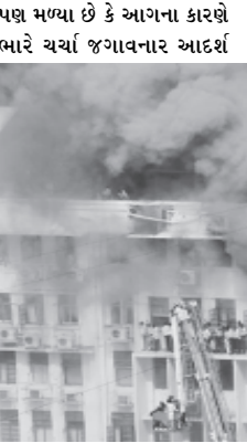
કોભાડની અનેક ઉપયોગી ફાઈલો પણ નાશ પામી છે. અને ઉલ્લેખનીય છે કે આ કોભાડમાં