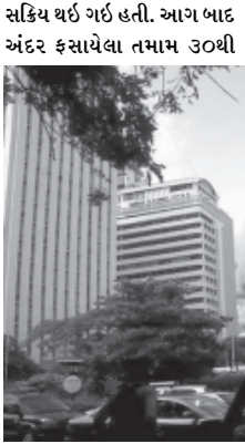
વધારે લોકોને બચાવી લેવામાં આવ્યા છે. કેટલાક લોકોએ જોખમી રીતે બારીમાંથી બહાર

મુંબઈ, તા. ૨૧ મહારાષ્ટ્રના મંત્રાલયમાં આજે ફાટી નિકળેલી ભીષણ આગના મામલે ઉચ્ચસ્તરીય તપાસનો આદેશ આપી દેવામાં આવ્યો છે. આ મામલે કોઈ માનવી ખુવારી ન થતા તંત્રને રાહત થઈ છે પરંતુ આગના કારણે કરોડોનું નુકસાન થયું છે. ભીષણ આગના બનાવમાં ૧૧ લોકો દાહ ગયા હતા. ફાયરબ્રિગેડે ભારે જહેમત બાદ આગ પર કાબુ મેળવી લીધો હતો. આગ પર કાબુ મેળવવામાં આશરે બે કલાકનો સમય લાગ્યો હતો. જોકે આ આગની ઘટના બાદ ટ્રાફિક જામની સ્થિતિ સર્જાઈ હતી. ફાયર બ્રિગેડની ૨૫થી વધારે ગાડીઓ આગ પર કાબુ મેળવવા