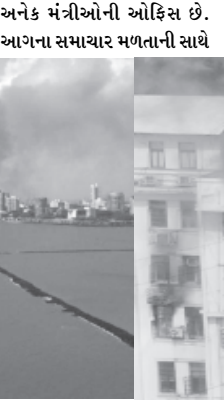
જ તંત્રમાં ભાગદોડ મચી ગઈ હતી. લોકોમાં પણ ભાગદોડ મચી ગઈ હતી. એવા બિન સત્તાવાર અહેવાલ