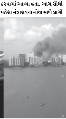
હતી. ત્યારબાદ આગ ઝડપથી અન્ય જગ્યાએ ફેલાઈ ગઈ હતી. આ ઈમારતમાં મુખ્યપ્રદાન સહિત