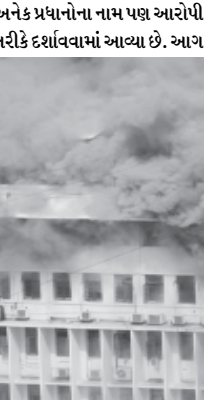
ફાટી નિકળી ત્યારે કેટલાક લોકો મંત્રાલયની છત પર પણ હતા. દક્ષિણ મુંબઈમાં મંત્રાલય

ઈમારતમાં આગ ફાટી નિકળ્યા બાદ મુખ્યપ્રદાન પૃથ્વીરાજ ચોહાણે તપાસનો આદેશ આપ્યો હતો. રાજ્ય સરકારના આદેશ મુજબ મુંબઈ કોર્ટમ બ્રાન્ચ આ મામલે તપાસ કરશે. આગ શોર્ટ સર્કિટના કારણે ફાટી નિકળી હતી. આગ ફાટી નિકળી ત્યારે મુખ્યપ્રદાન તેમની ઓફિસમાં ન હતા. નેવી કમાન્ડો અને મરીન કમાન્ડો તેમના ખાસ સાધનો સાથે પહોંચી ગયા હતા. હેલિકોપ્ટરની સેવા પણ લેવામાં આવી હતી. મહારાષ્ટ્ર આદિવાસી બાબતોના પ્રદાનની કેબિનમાંથી આગની શરૂઆત થઈ હતી. બપોરે ત્રણ વાગ્યે આગની જાણ થતા તરત ફાયર બ્રિગેડને જાણ કરવામાં આવી હતી.