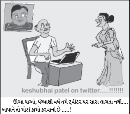
કેશુભાઈ પટેલ પર સારા લાગતા નથી... બાપાને તો મોટાં કામો કરવામાં છે.....!