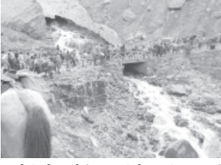
હિલ્કોટરની સેવા પણ ઉપયોગ કરાઈ રહ્યો છે. રાજ્યના રાજધાની અને શ્રીઅમરનાથ શ્રાઈની અમરનાથ યાત્રા

ગુફા તરફ આગળ વધવા ૨૫૦૦ શ્રદ્ધાળુઓને લીલીડંડી આપવામાં આવી હતી. ગુફા પર પહોંચવા ચાર દિવસનો સમય લાગે તેવા પહેલગામ ટ્રેકનો ઉપયોગ પણ ઘણા શ્રદ્ધાળુઓ