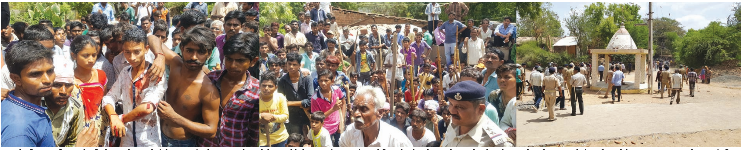
ખેડા જિલ્લાના નડિયાદ પાસેના બિલોદરા ગામે ભરવાડોમાં ભેલાણ કરતાં ઠાકોર સમાજના બે યુવાનોએ ભરવાડોને ભેલાણ કરતાં અટકાવતાં મામલો બિચક્યો હતો. અને ભરવાડો-દરબારોના ટોળાઓ સામસામે આવી ગયા હતા. જેમાં સાતથી વધુ લોકો ઘાયલ થયા હતા. ઘટનાની જાણ થતાં નડિયાદ ગ્રામ્ય પોલીસ ઘટના સ્થળે દોડી જતાં બે પોલીસ કર્મચારી અને એક અધિકારી પર ટોળાએ હુમલો કરતાં ઈજાઓ પહોંચી હતી. હુમલાખોરોએ પોલીસના વાહન પર હુમલો કરી ભારે તોડફોડ કરી હતી. ઘાયલોને તાત્કાલિક સારવાર માટે નડિયાદની સ્થાનિક હોસ્પિટલમાં ખસેડવામાં આવ્યા હતા. આ ઘટના સંદર્ભે નડિયાદ ગ્રામ્ય પોલીસ દ્વારા વિસ્તારમાં ભારે પોલીસ બંદોબસ્ત પડકી દેવામાં આવ્યો હતો.