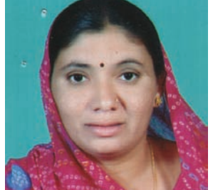
ગીતાતા વાઇ ઊલોલા