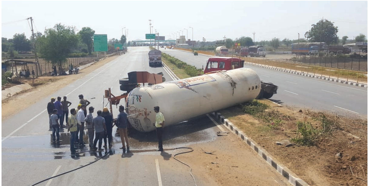
અમદાવાદ - વડોદરા સુપર એક્સપ્રેસ હાઈવે પર ખેડા જિલ્લાના સંઘાણા ગામ પાસે એલપીજી ગેસ ભરેલી ટેન્કર પલટી ખાઈ જતા અફ ડાટફ ડી મચી જવા પામી હતી. સુરક્ષાના કારણોસર હાઈવે ઓછોરીટી દ્વારા ૨ કિ.મી. સુધીનો રસ્તો બંધ કરી દેવામાં આવ્યો હતો. બાદમાં નડિયાદ ફાયરબ્રિગેડે આવીને પાણીનો મારો ચલાવ્યો હતો.