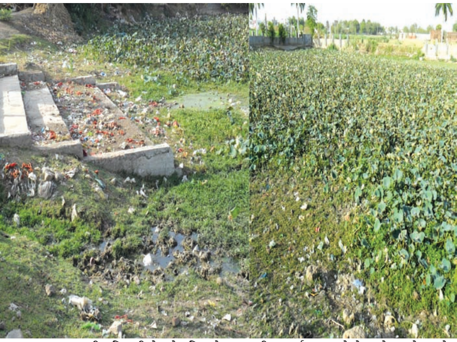
“સમય સમયની બહિષ્કારી છે” જે હકિકતને આ તસવીર સમર્થન પુરૂ પાડે છે. તલોદ ખાતે મહાદેવ સમીપ આવેલ તળાવ અનેક સુકી-લુલી જોવા મજબુર રહ્યું છે. સુંદર મનભાવન કમળના વેલાથી શુશોભિત એક સમયનું આ તળાવ આજે ગંદકી, કાદવ-કીચડ-કચરો અને નકામી વનસ્પતિને કારણે પંથકમાં રહીશો માટે ત્રાસદાયક પુરવાર થયું છે. તંત્ર જાગ્રત બને અને આ તળાવની તાકીદે સફાઈ કરાવે તેવી પ્રયત્ન માંગ સંખ્યાબંધ પરિવારોએ કરી છે.