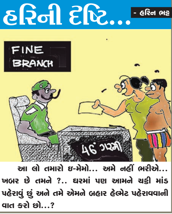
આ લો તમારો ઇ-મેમો... અમે નહીં ભરીએ... ખબર છે તમને ?.. ઘરમાં પણ આમને ચક્રી માંડ પહેરાવું છું અને તમે એમને બહાર ઢેલેટ પહેરાવવાની વાત કરો છો...?