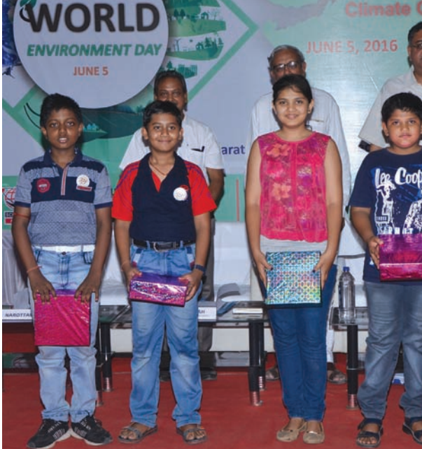
વિશ્વ પર્યાવરણ દિવસ : સાયન્સ સિટી ખાતે વિશ્વ પર્યાવરણ દિવસની ઉજવણી કરાઈ હતી. ગુજરાત ઊર્જા વિકાસ એજન્સી અને સાયન્સ સિટી તથા ગુજરાત કાઉન્સિલ ઓફ સાયન્સ એન્ડ ટેકનોલોજીના સંયુક્ત ઉપક્રમે વિવિધ કાર્યક્રમો યોજાયા હતા. આ પ્રસંગે કલાઈમેટ ચેન્જ વિભાગના પ્રિન્સિપાલ સેક્ટરી એસ. જે. હૈદર, ગુજરાત વિદ્યાપીઠના ઉપકુલપતિ ડૉ. અનામિક શાહ ઉપસ્થિત રહી માર્ગદર્શન આપ્યું હતું.

સોંપવામાં આવી છે. માધ્યમિક વિભાગમાં પણ પ્રવેશોત્સવ અન્વયે જિલ્લાની ૨૦૦ શાળાના આચાર્યને કાર્યક્રમ યોજવા માટેનું આયોજન કરવામાં આવ્યું છે. શાળાના આચાર્યને આસપાસના ગામમાં ધોરણ ૯ માં તાલીમ આપવામાં આવી છે. જિલ્લા શિક્ષણાધિકારીની અધ્યક્ષતામાં તાલીમ કાર્યક્રમ યોજવામાં આવ્યો હતો. આ દરમિયાન પ્રથમ દિવસે શાળાની સફાઈ, યોગ નિદર્શન તેમજ સાંસ્કૃતિક પ્રવેશ માટે એકપણ વિદ્યાર્થી વચિત ન રહે તે માટે પણ કાળજી રાખવા સુચના આપવામાં આવી છે. આ ઉપરાંત પ્રવેશોત્સવ દરમિયાન ઉપસ્થિત અધિકારીઓ વિદ્યાર્થીઓની ધોરણ ૯