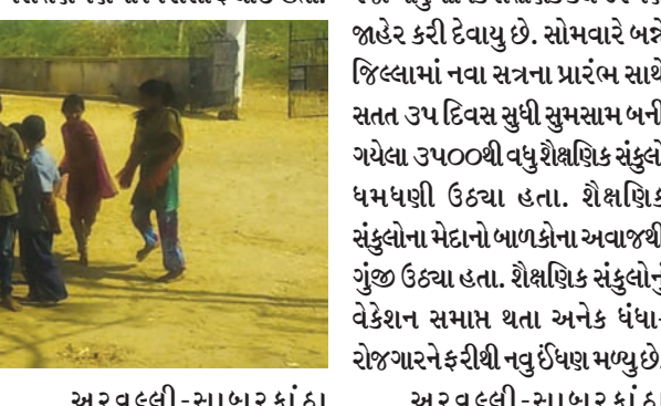
જિલ્લામાં દર વર્ષની જેમ સત્રના આરંભે પ્રવેશોત્સવ તથા ગુણોત્સવની ઉજવણી કરવામાં આવનાર છે. જે માટે ૮ થી ૧૦ જૂન અંતર્ગત આ કાર્યક્રમો યોજાનાર હોવાનું જાણવા મળેલ છે. મોડાસા ખાતેના પ્રવેશોત્સવમાં ૧૭મી જૂનના રોજ રાજ્યના મુખ્યમંત્રી આનંદીબેન