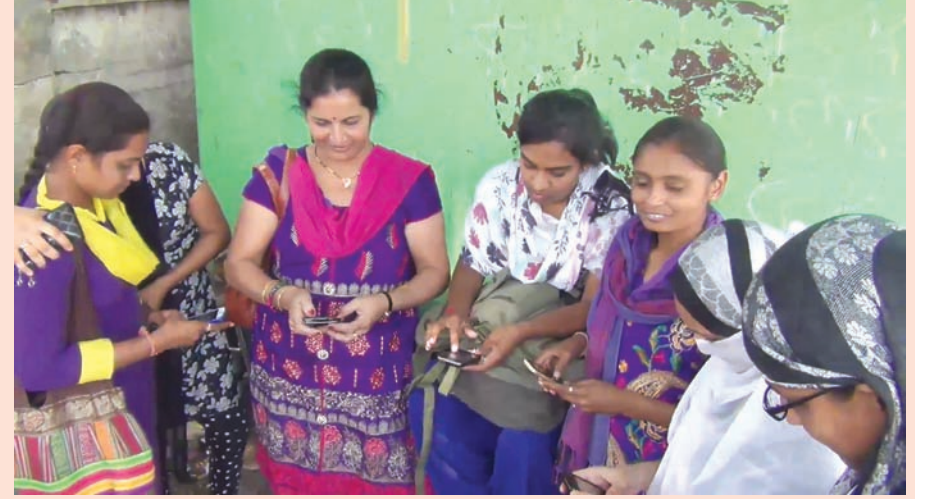
મુખ્યમંત્રી આનંદીબેન પટેલ મોડાસા શહેરની મુલાકાતે આવનાર છે ત્યારે વાઈ-ફાઈ સીટીની મુલાકાત લઈ વાઈ-ફાઈ સીટીની હવા કેમ નીકળી ગઈ? વાઈ-ફાઈ સીટી બંધ કરવાના કારણો તેમજ જવાબદાર તંત્ર સામે પગલા ભરવામાં આવે તેવું પ્રજાજનો ઈચ્છી રહ્યા છે.

ફોર્મ ભરી કનેકશન મેળવી ઘેર બેઠા કે પછી બંધા રોજગારના સ્થળે ઈન્ટરનેટની મજા માણવાના સપના અધુરા રહેતા વાઈ-ફાઈના સિગ્નલ કે કનેક્ટીવિટી મેળવવા ગ્રાહકોએ ટાવરની નજીક જવા મજબુર થયું પડતું હતું. મોડાસા શહેરમાં વાઈ-ફાઈના ૨૨ ટાવર નાખી સમગ્ર