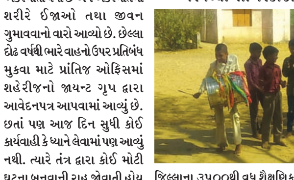
જિલ્લાના ૩૫૦૦થી વધુ શૈક્ષણિક સંકુલો સોમવારે બાળકોના કોલાહલથી ગુંજી ઉઠ્યા હતા. ૩૫ દિવસના ઉનાળું વેકેશન પુર્ણ થતા પ્રાથમિક શિક્ષકો અને ઉચ્ચતર માધ્યમિક શિક્ષકો દે જૂનથી શૈક્ષણિક કાર્યમાં ગુંથાઈ ગયા હતા. બન્ને જિલ્લામાં સત્રના પ્રારંભમાં જ પ્રવેશોત્સવ અને ગુણોત્સવની વિજાપુરમાં બ્રાહ્મણ સમાજ સેવા મંડળની વાડીનો ઉદઘાટન સમારોહ યોજાશે