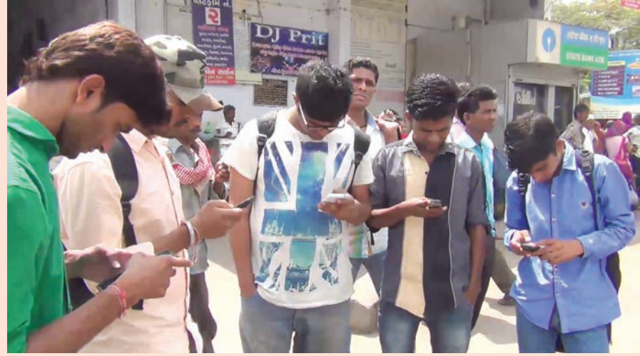
વાઈ-ફાઈ શહેર જાહેર કરતા મોડાસા શહેર દેશમાં વાઈ-ફાઈ સીટી તરીકે છવાઈ ગયું હતું. પરંતુ વાઈ-ફાઈ શહેરની જાહેરાત ફક્ત સસ્તી પ્રસિધ્ધિ મેળવવા વડીવટી તંત્રએ જાણે ઉતાવળે લીધેલો નિર્ણય હોય તેમ વાઈ-ફાઈની માળખાગત સુવિધાના અભાવે અને કનેક્ટીવિટી ન મળતા વાઈ

સરકારી સુત્રોના જણાવ્યા મુજબ આગામી ૧૭ જુને રાજ્યના