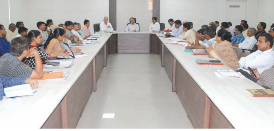
રાજ્યવ્યાપી યોજનાર યોગ દિવસની ઉજવણી અરવલ્લી જિલ્લામાં પણ કરવામાં આવશે. જે અંગેની યોજાયેલ બેઠકમાં વિગત આપતા જિલ્લા પ્રભારી સચિવશ્રી આર.એમ. જાદવ, અરવલ્લી જિલ્લામાંથી પણ લોકો મોટી સંખ્યામાં યોગમાં જોડાય તેવું જિલ્લા વહિવટીતંત્ર

દ્વારા આયોજન હાથ ધરવામાં આવ્યું છે. જેમાં આ દિને જિલ્લાના મુખ્ય તાલુકા મથક ખાતે તેમજ ગ્રામ્ય વિસ્તાર, તા. ૧૪ જુનથી શરૂ થનાર યોગ તાલીમ શીબીરમાં જોડાવવા કલેક્ટરશ્રીએ દ્વારા અનુરોધ કરવામાં આવ્યો છે.