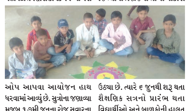
ઉઠ્યા છે. ત્યારે ૬ જૂનથી શરૂ થતા શૈક્ષણિક સત્રનો પ્રારંભ થતા વિદ્યાર્થીઓ અને બાળકોની હાલત કફોડી બની રહેશે. ઉનાળું વેકેશન લંબાવા થઈ રહેલી વાતો અને આશાઓ ઠગારી નિવડી હતી. નવા શૈક્ષણિક સત્રનો પ્રારંભ રાખેતા મુજબ ૬ જૂન સોમવારથી શરૂ થઈ ગયું હતો. ગ્રામ્ય વિસ્તારમાં કેટલાક બાળકો બાળમસ્તીમાં ઢોલ સાથે શાળાએ આવતા બાળકો ઝુમી ઉઠ્યા હતા. ટેબડાના યુવાનનું રાજકોટ પાસે અકસ્માતમાં મોત