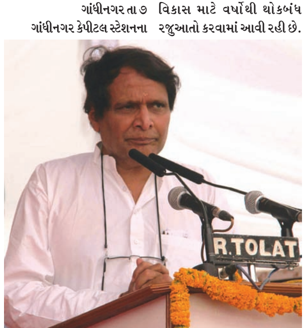
ગાંધીનગર તા. ૭ વિકાસ માટે વર્ષોથી થોકબંધ ગાંધીનગર કેપિટલ સ્ટેશનના રજૂઆતો કરવામાં આવી રહી છે.

કેપિટલ સ્ટેશનનો પણ નજારો બદલાશે : મહેસાણામાં રેલવે મંત્રીની જાહેરાત