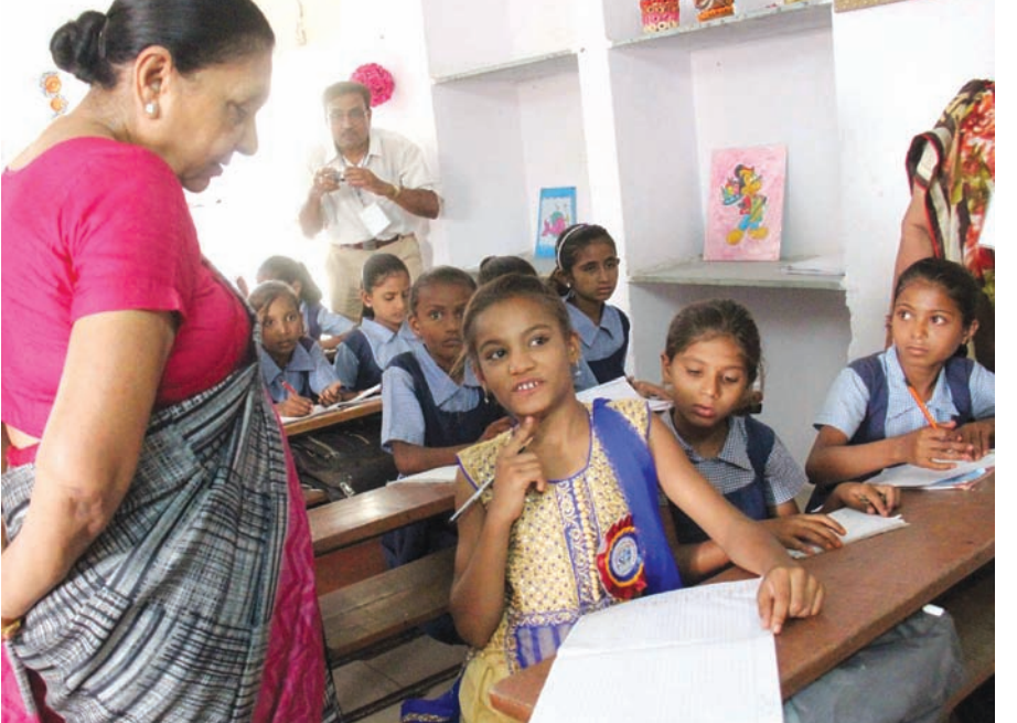
શિક્ષકની ભૂમિકામાં મુખ્યમંત્રી - આજીવન શિક્ષક અને શ્રેષ્ઠ શિક્ષકના એવોર્ડ વિજેતા શ્રીમતી આનંદીબેન પટેલ મુખ્યમંત્રી તરીકે પ્રવેશોત્સવના અંતિમ ચરણમાં મોડાસાની પ્રાથમિક શાળામાં શિક્ષકની ભૂમિકામાં બાળકોને ભણાવ્યા તે પ્રસંગની લાક્ષણિક તસવીર...

ગાંધીનગર, તા. ૧૭ ગાંધીનગર શહેરનો સમાર્ટ સીટી પ્રોજેક્ટમાં સમાવેશ થાય તે માટે તંત્રની તડામાર તૈયારીઓ વચ્ચે પણ જમીનની ઉપલબ્ધતા સહિતની અનેક ખામીઓને લઈ આ વખતે પણ સમાવેશ થશે કે કેમ તેની શંકા-કુશંકાઓ લોકજીભે રમતી થઈ છે. ગાંધીનગર શહેર એક સુઆયોજિત નગર હોવાને કારણે અહિં વિકાસની ગતિ અત્યંત ધીમી રહી છે. અહિં વસ્તીનું પ્રમાણ ઓછું છે એટલું જ નહિ વસ્તી વૃદ્ધિનો દર સતત ઘટી રહ્યો છે. મળતી વિગતો પ્રમાણે ૩૦ સેક્ટરોની અંદર વહેંચાયેલા આ નગરમાં આંતરિક વાહન-વ્યવહાર માટેની અપૂરતી વ્યવસ્થા, લોકો સીમીત આવાક ધરાવતા હોવાથી જનભાગીદારીની ઓછી શક્યતાઓ ઉપરાંત પ્રતિકૂળ હવામાનને લઈ આ વખતે પણ સ્માર્ટસીટી પ્રોજેક્ટમાં સમાવેશ થશે કે કેમ ? તેને લઈ પ્રશ્નર્થ છે. આ નગર માટે કચરાના નિકાલની યોગ્ય વ્યવસ્થાનો અભાવ આજે પણ ઉડીને આંખે વળગે તેવી સમસ્યા છે. આ નગર માત્ર ને માત્ર મોટર માર્ગ જ જોડાયેલું છે. અહિં રેલવેની સુવિધા અંગે કેન્દ્ર દ્વારા સતત અત્યાચ કરવામાં આવી રહ્યો છે. એક સરખી ડિઝાઈન ધરાવતા સેક્ટરોને લઈ વિકાસ માટેના સ્થળ શોધવાની મુશ્કેલી સૌથી મોટી છે. આ નગરને સોલાર સીટી બનાવવાનું સ્વપ્ન તત્કાલીન મુખ્યમંત્રી નરેન્દ્ર મોદીએ ૨૦૦૨માં નગરના જન્મદિનની ઉજવણી દરમ્યાન વ્યક્ત કર્યું અને આ પછી અનેકવિધ પ્રયાસોને અંતે અત્યારે