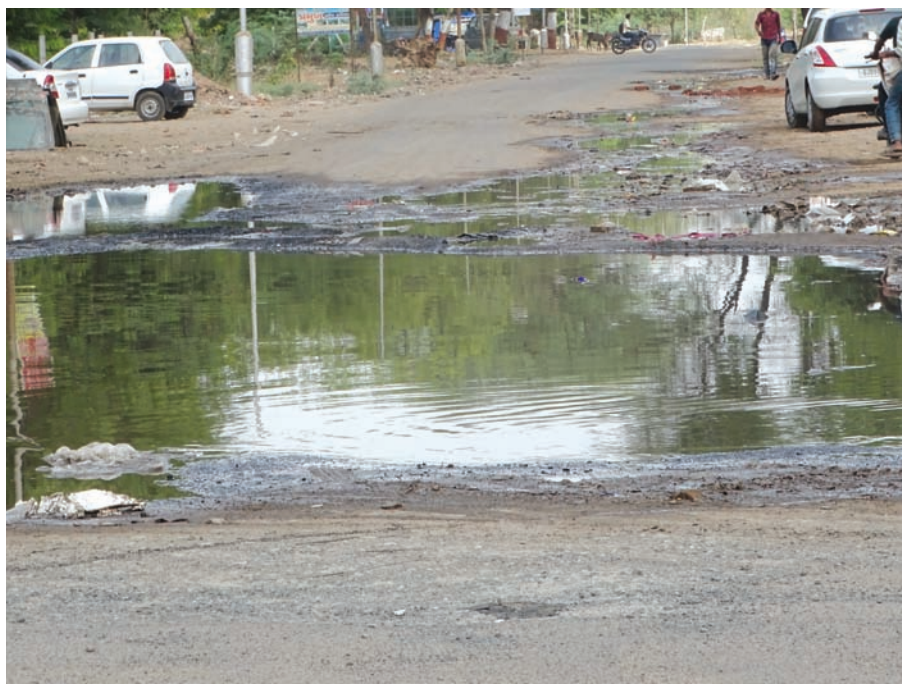
ગટરનું ગંદુ પાણી - સેક્ટર-૨૮ જીઆઈડીસી વિસ્તારમાં ગટરનું ગંદુ પાણી ઉભરાતા ભારે દુર્ગંધ પ્રસરી ગઈ હતી... જીઆઈડીસી વિસ્તારમાં વારંવાર પાણીની પાઈપ લાઈન કે ગટરની પાઈપ લાઈનમાં લિકેજના પ્રશ્નો સર્જાય છે... શુક્રવારે વહેલી સવારથી ગટર ઉભરાતા રાહદારીઓ માટે અને ઉદ્યોગકારોને ભારે હાલાકી ભોગવવી પડી હતી...