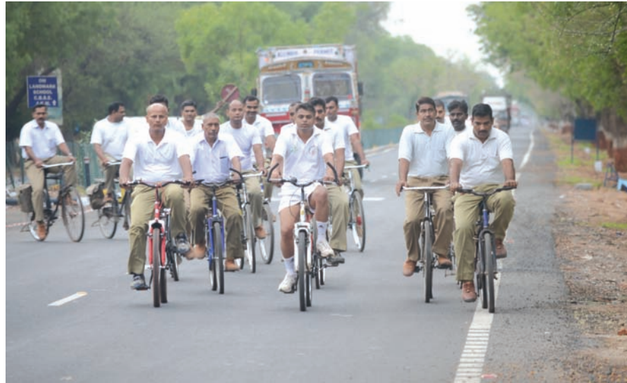
ડુંગ, દૂષણ અને માનવ તસ્કરી સામેના આંતરરાષ્ટ્રીય દિનની ઉજવણી બીએસએફ ગાંધીનગર કેમ્પસ ખાતે કરવામાં આવી હતી. આ અવસરે સાયકલ રેલી સહિતના વિવિધ કાર્યક્રમો યોજાયા હતા.

મુખ્યમંત્રીએ રાજ્યના ૫૪ રેપ્યુટી કલેક્ટરોને તાજેતરમાં જાહેરનામું પ્રસિધ્ધ કરીને અધિક કલેક્ટર તરીકે બઢતી આપવામાં આવી છે. આ બઢતી પામેલા ૫૪ અધિક કલેક્ટરો પૈકી ૨૫ જેટલા અધિક કલેક્ટરો ઉપસ્થિત રહીને તા. ૧૪-૬-૧૬ના રોજ મુખ્યમંત્રીની શુભેચ્છા મુલાકાત લીધી