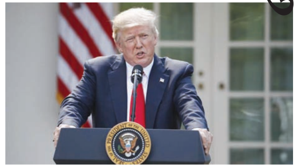
● અનુસંધાન પાન-૫ પર

નવી દિલ્હી, તા. ૨ અમેરિકા પ્રમુખ ડોનાલ્ડ ટ્રમ્પે જાહેરાત કરી છે કે, અમેરિકા હવે પેરિસ ક્લાઈમેટ ડિલના હિસ્સા તરીકે રહેશે નહીં. ટ્રમ્પે જાહેરાત કરી છે કે, તેઓ પોતાના અમેરિકન વર્કર્સ ફર્સ્ટના વચનને પૂર્ણ કરવાની દિશામાં આગળ વધી રહ્યા છે અને આનાથી વધુ સારી ડિલની આશા રાખે છે. ટ્રમ્પે પોતાના મોટા ફટકો પડી શકે છે. ટ્રમ્પે પોતાના ચૂંટણી પ્રચાર દરમિયાન કહ્યું હતું કે, અમેરિકા આ ડિલથી પીછેહઠ કરી જતાં ક્લાઈમેટ