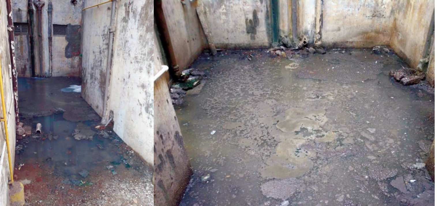
સેક્ટર-૨૫ જીઆઈડીસીમાં છેલ્લા ૩ મહિનાથી ગટરો ઉભરાતા સ્થાનિક રહીશો ત્રાહીમામ પોંકારી ઉઠ્યા છે. રહેણાંક વિસ્તારમાં આરસીએલ-ઈ બ્લોક પાસે ગટરનું દુષિત પાણી ઉભરાવવાથી મદબદતી ગંદકી વચ્ચે રહીશો ગુંગળામણ અનુભવી રહ્યા છે. ગંદકીને લીધે સ્થાનિક રહીશોમાં રોગચાળાની દહેશત પ્રવર્તે છે. ત્વરિત અસરથી આ સમસ્યાનું નિરાકરણ આવે તેવી માંગ ઉઠવા પામી છે.