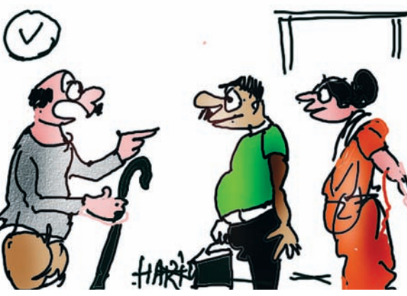
મારી દવાનાં કાગળ તારાથી ખોવાઈ જાય છે... હમણાં વીલ બનાવી દઈ તો તે ક્યારેય ન ખોવાઈ જાય...!