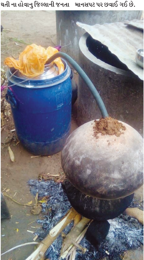
થતી ના હોવાનું જિલ્લાની જનતા માનસપટ પર છવાઈ ગઈ છે.

દિન પ્રતિદિન કાયદો વ્યવસ્થાની સ્થિતિ કથળતી જાય છે. પોલીસતંત્રની ખાખી વરધીની બીક દેશી દારૂની ભઠ્ઠીઓ ચલાવતા અસાજિક તત્વોને રહી નથી કે પછી પોલીસતંત્રની રેહમ નજર હેઠળ સમગ્ર જિલ્લામાં દેશી દારૂની ભઠ્ઠીઓ ધમધમી રહી છે તેવી આમ આદમીમાં ચર્ચા સમગ્ર જિલ્લા સહીત વાતક નદી, મેશ્વો નદી, માજુમ નદીના તટમાં સહીત ખુલ્લેઆમ કેટલાક બુટલેગરો ખેતરોમાં દેશી દારૂની ભઠ્ઠીઓ ચલાવી દેશી દારૂનું ઉત્પાદન કરી