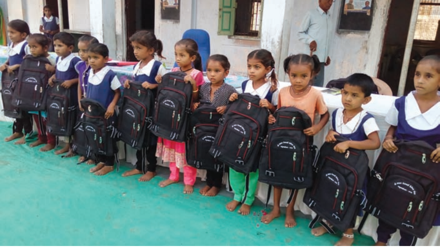
શાળામાં કન્યાઓના પ્રવેશનો દબદબો રહ્યો તો માધ્યમિકમાં કુમારોના પ્રવેશનો દબદબો રહ્યો અને આંગણવાડીમાં

ગાંધીનગર, તા. ૮ જિલ્લાના ગ્રામ્ય વિસ્તારમાં આજથી શરૂ થયેલા ત્રિદિવસીય પ્રવેશોત્સવના પ્રથમ દિવસે પ્રાથમિક કુમાર-કન્યા બેલગભગ સરખેસરખો પ્રવેશ મેળવ્યો છે. શાળા પ્રવેશોત્સવના પ્રથમ દિવસે જિલ્લામાં રહી છે. આજે પ્રથમ દિવસે જિલ્લાના ગ્રામ્ય વિસ્તારોના પ્રવેશ કાર્યક્રમમાં ત્રણ સનદી અધિકારીઓ અગત્યના રોકાણને લઈ હાજર રહી શક્યા ન