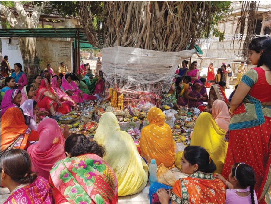
વડ સાવિત્રીનું વ્રત - પતિના આયુષ્ય માટે પત્ની દિવસભર ઉપવાસ કરે અને વડનું પૂજન કરે... એવા અનોખા વ્રતનો મહિમા ભારતીયસંસ્કૃતિમાં હંમેશા અગ્રસ્થાને રહ્યો છે... ભારતીય નારીને નારાયણી એટલા માટે જ કહેવાય છે કે પરિવારના કલ્યાણ માટે જીવન સમર્પિત કરે છે... જીવનની આચારસંહિતાનું ડગલે ને પગલે અમલ કરતી નારી ભારતીય સમાજ જીવનનમાં લક્ષ્મી સ્વરૂપા મનાય છે... તપ અને વ્રતથી નારીનું સ્થાન કેન્દ્રમાં રહ્યું છે... વડની પૂજા કરી સુતરના તાંતણે પતિના સ્વાસ્થ્ય અને આયુષ્ય માટે પ્રાર્થના કરવાની ભાવના સાથે વડ સાવિત્રીનું વ્રત ભારે ઉલ્લાસપૂર્વક ગાંધીનગરમાં ઉજવાયું હતું... ગાંધીનગરની મહિલાઓએ મોટી સંખ્યામાં પૂજન - અર્ચન કરી વ્રતમાં શ્રદ્ધા વ્યક્ત કરી હતી...