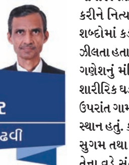
કાણના ચણીબોર વી. એસ. ગઢવી

ગમે તેવા છે. વિનોબાજી આ સમયમાં એક વાર સખત બીમાર પડી ગયા. સર્વોદયના સૌ કાર્યકર્તાઓ વિનોબાજીની તબીયત અંગે ચિંતિત રહેતા હતા. આ સમયે એક સમયે દાદા વિનોબાજીની નાદુરસ્ત તબીયતના સમાચાર સાંભળી તેમને મળવા ગયા. વિનોબાજી સાથે ભૂદાનયજન કાર્યની પ્રગતિ વિશે વાત કરતા દાદા વિનોબાજીને કહે છે : " તમે કામની ચિંતા છોડી દો. અમારું જગુ શું છે તે હું જાણું છું. પરંતુ ભૂમિદાન યજનો ઘોડો તમે છો તો એ ન ભૂલતા કે હું આ યજનો ગધેડો છું ! " દાદાની વિનોદવૃત્તિ જાણનારા અને આ સંવાદ સાંભળનારા સૌ બડબડાટ હસી પડ્યા. દાદા કહે છે આવું કહીને મારી પાસે જે કંઈ છે તે સર્વસ્વનું સમર્પણ ભૂદાનયજ માટે કરવાની મારી તૈયારી હતી. વિનોબાજી પણ પોતાના ભૂમિદાન યજના કાર્યને પ્રજાસૂચ યજ તરીકે ઓળખાવીને તેનું ગૌરવ પ્રસ્થાપિત કરતા હતા. અનેક દેશવાસીઓને વિનોબાજી ભૂમિ માગનારા પૌરાણિક કથાના વામનના અવતાર સમાન લાગતા હતા. ભૂદાનયજનો અથાક પરિશ્રમ કરીને કૃશ કાય થઈ જનારા વિનોબાજીને એક વખત દાદાએ કહ્યું : " લોકો તમને વામનની ઉપમા આપે છે પરંતુ મને તમારી પ્રક્રિયામાં વામન તથા દધીચીનું મિશ્રણ જોવા મળે છે. " વિનોબાજીએ હળવાશથી જવાબ આપતા દાદાને કહ્યું : " હા, દહી ખાઈ રહ્યો છું એટલે દધીચી કહી શકો છો. " બન્ને