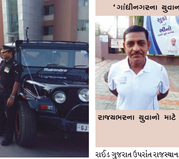
રાઈડ ગુજરાત ઉપરાંત રાજસ્થાન, હરિયાણા, હિમાચલ પ્રદેશ થઈ જમ્મુ કાશ્મિર પહોંચશે જ્યાં લેહ-લદાખ સેત્રના વિવિધ સ્થળોની મુલાકાત લેશે. સાહસિક બાઈક રાઈડ સાથે દેશભક્તનો અનોખો સંગમ ગાંધીનગરના અન્ય યુવાનો માટે પ્રેરણાદાયક બની રહેશે.