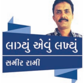
લાગ્યું એવું લાગ્યું સમીર રામી

શાળાઓમાં નામ પુરતો પ્રવેશ અપાવી વિદ્યાર્થીઓને સ્પર્ધાત્મક પ્રવેશ પરીક્ષાઓ માટે તૈયાર કરતી ખાનગી કલાસીસની બોલબાલા વધી : નીટ, જેઈઈ અને ગુજકેટ વગેરેના કારણે બોર્ડની પરીક્ષાઓનું મહત્વ ઘટતું જણાતા વાલીઓ અવતવમાં