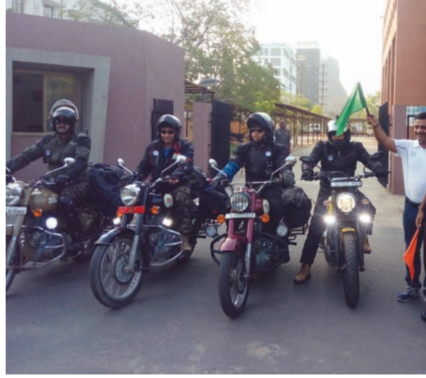
માલની પરવા કર્યા વગર બહાદુરીપૂર્વક દેશવાસીઓની રક્ષા કરતા ભારતના જવાનોને તેમના આયોજન કૃત્ય છે. રાઈડમાં ગાંધીનગર ઉપરાંત અમદાવાદ અને સૌરાષ્ટ્રના પણ કેટલાક યુવા રાઈડર્સ