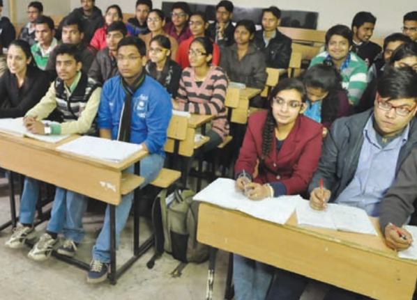
આવવાનું પુરવરા થવાનું છે જેના કારણે એકાએક વાલીઓની નજર ખાનગી કલાસીસ તરફ મંડરાવા લાગી છે. હવે શાળાકીય અભ્યાસક્રમ માત્ર એક ઔપચારિકતા બનતો જઈ રહ્યો છે અને બોર્ડની પરીક્ષા માટે શાળા પ્રવેશ અનિવાર્ય હોવાથી તેનું મહત્વ તેટલા પુરતું જ રહી જવા પામ્યું છે. ઉચ્ચ

ભાગ્યે તે સ્કૂલમાં જાય છે અથવા તો ક્યારેય તે સ્કૂલમાં જતા નથી પરંતુ તેમનો સંપૂર્ણ અભ્યાસ ખાનગી કલાસીસમાં થાય છે અને જેના માટે વાલીઓ પાસેથી તગડાં 'પેકેજ' વસુલાય છે. આ વિદ્યાર્થીઓ સંસ્થાના રંગબેરંગી અભ્યાસિક પોષાક અને લેટેસ્ટ બેગ સાથે રોજ કલાસીસમાં ભણવા જાય છે અને તેમની 'હાજરી' એ શાળામાં પુરાય છે જે તેમણે જોઈ જ નથી હોતી અથવા તો વર્ષના અમુક