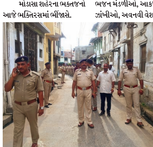
મોડાસામાં નીકળનાર ૩૫મી જગન્નાથની ભવ્ય શોભાયાત્રામાં અરવલ્લી જિલ્લા પોલીસે તંત્ર દ્વારા મોડાસા શહેરમાં નીકળનારી રથયાત્રાના રૂટ પર શનિવારે સાંજના સુમારે પોલીસે દ્વારા અધિકારી અને કર્મચારીઓ દ્વારા રૂટનું નિરીક્ષણ કરવામાં આવ્યું હતું.

મોડાસા, તા. ૨૪ મોડાસા-હિંમતનગર રોડ પર આવેલા દૂધેશ્વરી માતાજીના મંદિર નજીક શુક્રવારે સાંજના સુમારે મોડાસાના લઘુમતી કોમનો યુવાન એક્ટીવા લઈને કામકાજ અર્થે નીકળ્યો હતો. ત્યારે અજાણ્યા વાહને એક્ટીવાને અડફેટે લેતા એક્ટીવા ચાલક રોડ પર પટકાતા શરીરે ગંભીર ઈજાઓ થતા મોડાસાના દવાખાને પ્રાથમિક સારવાર આપી સઘન સારવાર અર્થે અમદાવાદ લઈ જતા યુવાનનું રસ્તામાં જ પ્રાણ પંખેરું ઉડી જતા સમગ્ર મુસ્લીમ વિસ્તારમાં મૃતક યુવાનના પગલે શોકની લાગણી ફેલાઈ હતી.