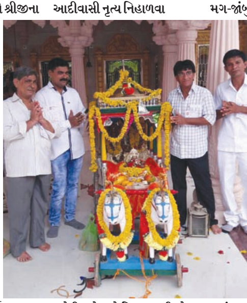
શહેરીજનો અને જિલ્લાવાસીઓ રથયાત્રાના રૂટ પર ઉમટી પડી જ્યાં મુસ્લીમ બિરાદરો દ્વારા રથયાત્રા સમિતિનું સન્માન કરી

મોડાસા, તા. ૨૪ મોડાસા શહેરમાં આજે પરંપરાગત રીતે ૩૫મી રથયાત્રામાં ભગવાન જગન્નાથ, ભાઈ ભલરામ અને બહેન શુભદ્રા સાથે રથમાં બિરાજમાન થઈ નગરયાત્રાએ નીકળી શહેરીજનોને દર્શન આપશે. વર્ષમાં એકવાર ભગવાન જગન્નાથજી સામે ચાલીને ભાવિકોને દર્શન આપવા નીકળતા હોવાથી ભક્તો ભગવાનના દર્શન કરવા અહીંના બન્યા છે. ૩૫મી ભવ્ય રથયાત્રામાં સઘન-યુક્ત પોલીસ બંદોબસ્તમાં ૩૫૦થી વધુ પોલીસકર્મીઓ ખરડેપગે તેનાટ રહેશે.