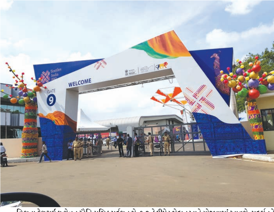
વિશ્વના ટેક્સટાઇલ ક્ષેત્રનું ઐતિહાસિક પ્રદર્શન સે-૧૭ હેલીપેડ મેદાન ખાતે યોજવામાં આવશે. પ્રદર્શનને અનુલક્ષી પુર્વતેયારીઓ કરી દેવાઈ છે. મહાત્મા મંદિર ખાતે ૩૦મી જુને કાપડ ઉદ્યોગની આંતરરાષ્ટ્રીય કોન્ફરન્સ ટેક્સટાઇલ ઈન્ડિયા -૨૦૧૭ નું આયોજન કરવામાં આવ્યું છે. ત્યારે આ દરમિયાન હેલીપેડ મેદાન ખાતે ટેક્સટાઇલ જગતનું સૌથી મોટું પ્રદર્શન યોજવામાં આવશે. જેમાં ૧૩૦ દેશના ૨ હજારથી વધુ પ્રતિનિધિઓ ભાગ લેશે. આ પ્રદર્શનના અંતે ગ્લોબલ માર્કેટમાં દેશની ઈકોનોમી વધુ મજબુત બનશે તેમ પણ મનાઈ રહ્યું છે. આ પ્રસંગે કેશન શો નું પણ આયોજન કરવામાં આવ્યું છે.

ગાંધીનગર તા. ૨૮ શહેરમાં વરસાદી દિવસો દરમિયાન ભયજનક વૃક્ષો અકસ્માતનું કારણ ન બને તે માટે વનતંત્ર દ્વારા આવા જોખમી વૃક્ષોની કટોતી કરવામાં આવી રહી છે. વરસાદી દિવસો દરમિયાન જ તંત્રના ધ્યાને આવેલા ૧૫ જેટલા ભયજનક વૃક્ષોને જમીનદોસ્ત કરવામાં આવ્યા છે. શહેરમાં વરસાદી ઋતુના પ્રારંભે જ ૧૦ જેટલા વૃક્ષો ધરાશાયી થયા હોવાનું પણ ધ્યાને આવ્યું છે. હરિયાણા વૃક્ષોની વનરાજી વચ્ચે ઘેરાયેલા નગરમાં મુખ્ય માર્ગો તેમજ સેક્ટરોના આંતરિક માર્ગો આસપાસ હરિયાણા વૃક્ષો જોવા મળી રહ્યા છે. જયારે વૃક્ષોની સંખ્યા વધુ હોવાના લીધે વૃક્ષોની જાળવણીનો મામલો પણ મુખ્ય બન્યો છે. વનતંત્ર દ્વારા વૃક્ષોના ટ્રીમીંગની સુંબેશ પુર્ણ કરી દેવામાં