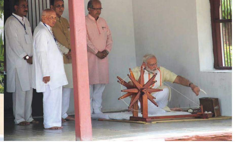
જણાવ્યું હતું કે સાબરમતી ગાંધી આશ્રમ વિશ્વ ફલક ઉપર પ્રસરે તે નિષ્ણ્વો કેન્દ્ર બિંદુ છે.

કોઈની હત્યા થાય તે આ દેશમાં સાંભી નહીં લેવા, કાયદાને તેનું કમ કરવા દો, કાયદો હાથમાં લેવાનો કોઈને અધિકાર નથી એવું પણ એમણે સ્પષ્ટ જણાવ્યું હતું. તેમણે