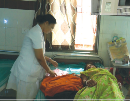
પ્રાંતિજ નેશનલ હાઈવે આઠ ઉપર આવેલ કેસોમાં ઘટાડો થયો છે.

તો બીજાબાજુ હાલ પ્રાંતિજ સી.એચ.સી ખાતે છેલ્લાં એક મહિનાથી સ્ટ્રી ડક્ટર (ગાયનેક) કે રાજનામું આપી દેતો જગ્યા ના ભરાતાં પ્રાંતિજ સહિત તાલુકામાં પ્રસુતિ માટે મહિલાઓને હિંમતનગર સહિત જવું પડે છે. ગાયનેક સ્ટ્રી નિષ્ણાત ના હોવાથી