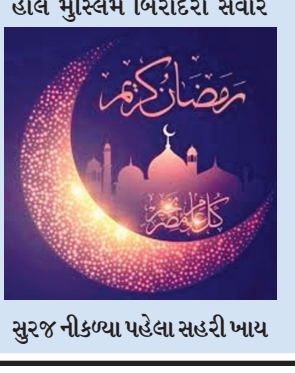
હાલ મુસ્લિમ બિરાદરો સવારે સુરજ નીકળ્યા પહેલા સહરી ખાય છે અને સાંજે સુરજ ઢળ્યા પછી નક્કી સમય પર ઈફતાર કરે છે તેમજ નિયમિત સિધ્ધતથી નમાજ પઢે છે અને કુરાન શરીફની તિલાવત કરે છે. રમઝાન માસ દરમિયાન રોઝા રાખનારે કુરાનના પઢીને જીવનમાં ઉતારવાનો પ્રયાસ કરવો જોઈએ અને જકાતને તેટલું જ પ્રાધાન્ય આપવું જોઈએ તેવું વર્ણવાયું છે. જેમાં જકાત એ કે તે પોતાની કમાણીમાંથી ભાગ કાઢી અલ્લાહ તેમજ ધર્મની રાહ ઉપર ખર્ચ કરે તે. આ જકાત સમાજના ગરીબોને આપતી હોય છે અને ફિત્રો (અનાજ) પણ આપાય છે. રોઝા રાખનારે જુદું બોલવું નહીં, ખરાબ કે ખોટું સાંભળવું નહીં કે કરવું નહીં તેવા કડક નિયમો પાળવાના હોય છે. રમઝાન મહિનાની ઈલ્લી રાત ચાંદ રાતના સ્વરૂપે મનાવાય છે. ચાંદ રાતમાં ઈદનો ચાંદ જોઈને મુસ્લિમ બિરાદરો બીજા દિવસે ઈદ ઉલ ફિત્ર મનાવે છે જેને મીઠી ઈદ પણ કહેવાય છે. હદીશના અનુસાર ઈદ ઉલ ફિત્ર અલ્લાહ આપેલી ભેટ છે. અને આ દિવસે સવારની નમાજનું ખાસ મહત્વ હોય છે. શહેરમાં સે-૧, ૨૯, ૫ તથા પેથાપુર, વાવોલ અને છાલામાં રમઝાન માસ પુખ્ત જ ધાર્મિકતાથી મનાવાઈ રહ્યો છે.

ગાંધીનગર, તા.૫ મુસ્લિમ ધર્મનો પવિત્ર માસ રમઝાન હાલમાં ચાલી રહ્યો છે. મુસ્લિમ બિરાદરો આ પવિત્ર માસમાં ખુદાની ઈબાદતમાં મગ્ન બન્યા છે જે ધાર્મિક માહોલ હાલ મસ્જિદ અને ઈદગાહમાં દખાઈ રહ્યો છે. ઈસ્લામીક કેલેન્ડરના હિસાબથી નવમો મહિનો રમઝાનનો હોય છે ત્યાર પછી ચાંદ જોઈને ઈદ ઉલ ફિત્રનો તહેવાર મનાવાય છે. માન્યતા છે કે રમઝાન મહિનામાં કુરાન અવતરિત થઈ હતી જેથી આ મહિનાનું મુસ્લિમ ધર્મમાં આગવું મહત્વ બન્યું છે. આ વર્ષે મે મહિનાના મધ્યથી રમઝાન માસનો પ્રારંભ થયો હતો અને જુન મહિનાના મધ્યાંતરે પુર્ણ થશે. રમઝાન માસ દરમિયાન મુસ્લિમ બિરાદરો રોઝા રાખે છે અને ખુદાની ઈબાદતમાં વ્યસ્ત રહે છે. આ પવિત્ર માસમાં તમામ