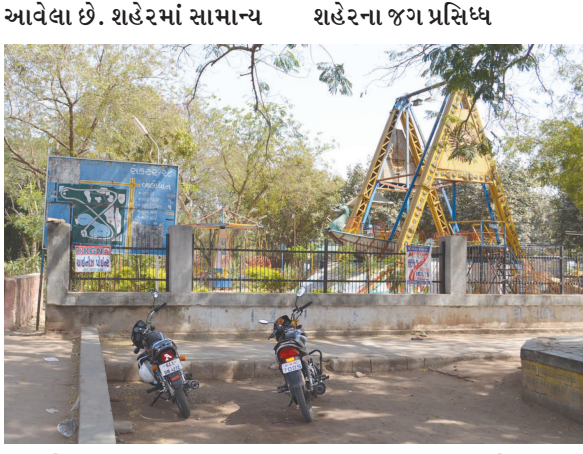
ગાંધીનગર શહેરમાં અનેક નાના-મોટા ફરવા લાયક અને જોવા લાયક સ્થળો આવેલા છે. શહેરમાં સામાન્ય શહેરના જગ પ્રસિધ્ધ

ગાંધીનગર, તા. ૧૬ ગાંધીનગર શહેરના ફરવા લાયક સ્થળો પર આજથી સહેલાણીઓની ભારે ભીડ થવા મળી હતી. પવિત્ર ઈદના તહેવારને પગલે શહેરના બાગ-બગીચાઓમાં પણ મુલાકાતીઓનો ભારે ધસારો રહ્યો હતો. ત્યારે શહેરના પર્વત સ્થળે આગામી ત્રણ-ચાર દિવસ સહેલાણીઓથી ધમધમતા રહેશે. શહેરના લાખો સહેલાણીઓને પગલે ચા-પાણી, નાસ્તા, હોટલ-રેસ્ટોરન્ટના વેપારીઓના ધંધા-રોજગારમાં પણ તેજી જોવા મળશે.