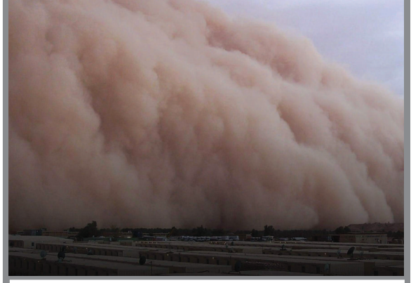
રેતનું વાવાગોડું એટલું ભયંકર હોય છે કે તે આખા શહેરને દફળ કરી શકે છે.