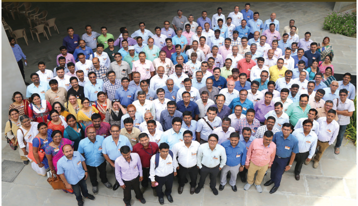
ઈન્ડિયન ઇન્સ્ટીટ્યુટ ઓફ ટેકનોલોજી, ગાંધીનગર ખાતે ટેકનીકલ એજ્યુકેશન ક્વોલિટી ઇમ્પ્રુવમેન્ટ પ્રોગ્રામની બીજી બેંચનો આરંભ કરવામાં આવ્યો છે, જેમાં અંજિનીયરિંગ ઇન્સ્ટીટ્યુટના ૧૬૦ જેટલા નોંધાયેલ પ્રિન્સિપાલ્સ અને ફેકલ્ટી મેમ્બર્સ ભાગ લઈ રહ્યા છે. ફેકલ્ટી અંજિનીયરિંગ કોલેજમાં શિક્ષણ હેતુ એક્ટીવ લર્નિંગ, ઓટોનોમી, ગવર્નન્સ એન્ડ મેનેજમેન્ટ તથા રિસર્ચ એન્ડ ડેવલપમેન્ટની તાલીમ પ્રાપ્ત કરી રહ્યા છે.