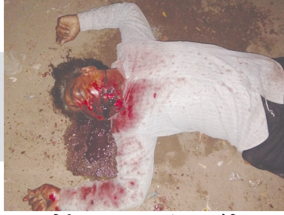
પ્રાપ્ત માહિતી અનુસાર ગાંધીનગર નજીકના કલોલ

પાસેની છત્રાલ જીઆઈડીસી આવેલી છે. જ્યાં ચાર માસ