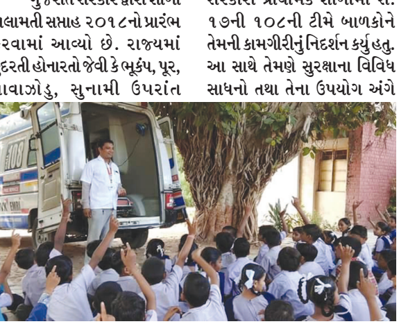
માનવસર્જિત આફતો જેવી કે આગ, રોડ અકસ્માત, રેલવે અકસ્માત, ઔદ્યોગિક અકસ્માત જેવી સ્થિતિમાં શાળા સલામતી ખૂબ જ અગત્યની

બની જાય છે. આ બાબતે જાગૃતિ ફેલાવવાના આશયથી ગુજરાત રાજ્ય ડિઝાસ્ટર મેનેજમેન્ટ ઓથોરિટી દ્વારા શાળાના બાળકો તથા શિક્ષકો માટે શાળા સલામતી સમાહનું આયોજન કરવામાં આવ્યું છે. આ અંતર્ગત સેક્ટર-૧ ૬ માં સરકારી પ્રાથમિક શાળામાં સે. ૧૭ની ૧૦૮ની ટીમે બાળકોને નેમની કામગીરીનું નિદર્શન કર્યું હતું. આ સાથે તેમણે સુરક્ષાના વિવિધ સાધનો તથા તેના ઉપયોગ અંગે