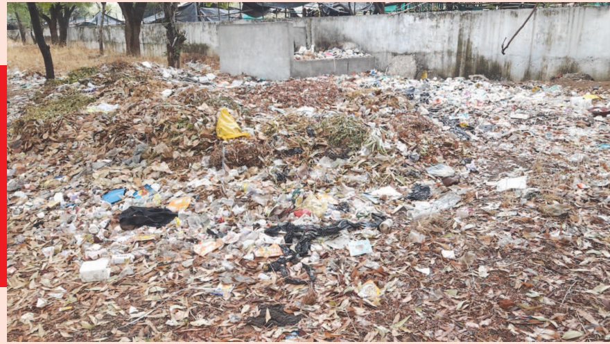
વચ્ચે ગાંધીનગરમાં ઠેર ઠેર કચરાના ઢગ ખડકાયા છે. રાજ્યની મોટાભાગની વહીવટી

કારણે અહીં ગંદકીનું સામ્રાજ્ય ફેલાયું છે. કર્મચારીઓ અને અધિકારીઓને અહીં નાહ્યુટકે