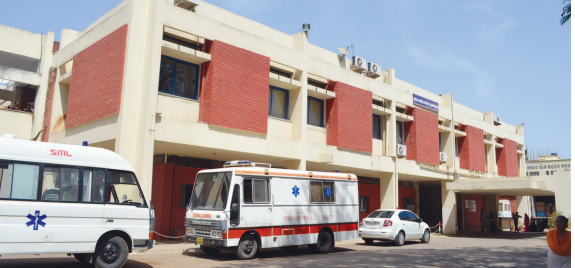
વોર્ડમાં કે દર્દીના બેડ પર ટપકે નહીં તેની માટે ખાસ આગોતરુ આયોજન તંત્ર દ્વારા હાથ ધરાયું છે. ગતુ વર્ષે ટપકતી છતને પગલે ડોલ તેમજ વાસણ મુકવાનો વારો આવ્યો હતો. તેમજ ગતુ વર્ષે વરસાદી પાણી વોર્ડમાં ફરી વળતા દર્દીઓ અને સ્ટાફને ભારે હેરાનગતિ વેઠવાનો વારો આવ્યો હતો. ત્યારે હાલના તબક્કે સિવિલ અને મેડીકલ કોલેજની તમામ

સ્થિતિ ઉભી થાય છે. જયારે પાણી ટપકતા હોવાથી ડોલ કે અન્ય વાસણ મુકવામાં આવે છે અને તે ભરાઈ ગયા બાદ ઢોળી દેવામાં આવે છે. વરસાદી પાણી ટપકતા હોવાથી સ્ટાફ તેમજ દર્દીઓ હેરાન પરેશાન થઈ જાય છે. ત્યારે હાલના તબક્કે પ્રિ-મોન્યુન પ્લાનની કામગીરી તંત્ર દ્વારા હાથ ધરવામાં આવી છે. જેમાં દરેક વોર્ડ, ઓપીડી બિલ્ડીંગ, લેબ, જુનુ બિલ્ડીંગ, ઓટી, હોસ્ટેલ, મેડીકલ કોલેજ, સહિતના સ્થળ પર જઈને ટપકતી છત વિશે પુછવામાં આવે છે અને જે સ્થળ પર પાણી ટપકતું હશે ત્યાં રીનોવેશન કરીને પાણી ટપકતું બંધ કરી દેવામાં આવશે. ચાલુ વર્ષે વરસાદી પાણી સિવિલમાં કોઈ સ્થળે ટપકે નહીં તે માટે તંત્ર દ્વારા માર્કોપ્લાનીંગ કરાયું છે.