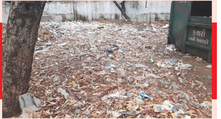
મળે છે. પ્લાસ્ટિક પર પ્રતિબંધના દાવા કરવામાં આવે છે પરંતુ અહીં પ્લાસ્ટિકના ઝબલા, કપ

મોટાભાગની કચેરીઓ જ્યાં આવેલી છે તે જુના સચિવાલયની સફાઈ પ્રત્યે ભારે દુર્લભ સેવવામાં આવી રહ્યું છે. કચેરીઓમાં તો સફાઈમાં