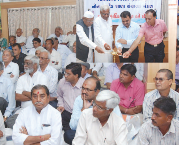
માર્ગદર્શન શિબિરનું આયોજન કરવામાં આવ્યું હતું. સરકાર દ્વારા ગાંધીનગર જિલ્લાની ગ્રાન્ટેડ શાળાઓમાં આચાર્યની ભરતી ટૂંક સમયમાં કરવામાં આવનાર છે. આ ભરતી પ્રક્રિયાના નિયમો, ધારાધોરણો અને સમગ્ર પ્રક્રિયાની સમજણ આપવા શાળા સંચાલકો માટે માર્ગદર્શન શિબિરનું આયોજન મંચુરેરીના હોલ ખાતે કરવામાં આવ્યું હતું. ગુજરાત