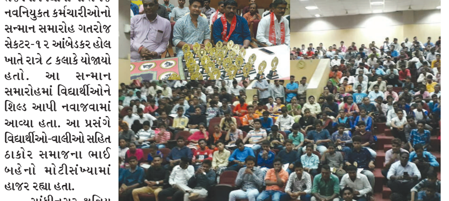
તેજસ્વી વિદ્યાર્થીઓ તેમજ નવનિયુક્ત કર્મચારીઓનો સન્માન સમારોહ ગતરોજ સેક્ટર-૧૨ આંબેડકર હોલ ખાતે રાત્રે ૮ કલાકે યોજાયો હતો. આ સન્માન સમારોહમાં વિદ્યાર્થીઓને શિલ્ડ આપી નવાજવામાં આવ્યા હતા. આ પ્રસંગે વિદ્યાર્થીઓ-વાલીઓ સહિત ઠાકોર સમાજના ભાઈ બહેનો મોટીસંખ્યામાં હાજર રહ્યા હતા. ગાંધીનગર ક્ષત્રિય

અને પ્રમાણપત્ર આપી સન્માનિત કરવામાં આવ્યા હતા. આ પ્રસંગે નવનિયુક્ત ભરતીમાં સરકારી