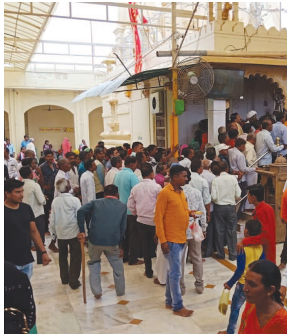
ખેડબ્રહ્મામાં માં અંબાના દર્શન કરવા માટે વહેલી સવારથી જ ભક્તોની લાંબી લાઈનો લાગી ગઈ હતી મોટી સંખ્યામાં ભક્તો એ માતાજીના દર્શન કરી ધન્યતા અનુભવી હતી.

હિંમતનગર, તા. ૨૭ હિંમતનગર શહેરમાં છેલ્લા કેટલાક સમયથી ફરફોડ ચોરીના બનાવો વધી રહ્યા છે. ત્યારે પોલીસ માટે આ પડકારરૂપ છે. દરમિયાન મંગળવારે રાત્રે શહેરના ગાંધી રોડ પર આવેલ એક જવેલર્સના તથા કાપડના શો રૂમમાં અજાણ્યા શખ્સોએ પ્રવેશ કરીને અંદાજે રૂ. ૧૦.૪૯ લાખની ચોરી કરીને જવેલર્સના શો રૂમના ધાબે જઈને આજુબાજુમાં આવેલ કાપડના સંસ્કૃતિ અને મીઠાલાલ પેલેસમાં ચોરી કરવાના ઈરાદે પ્રવેશ્યા હતા. જ્યાંથી સંસ્કૃતિ નામના કાપડના શો રૂમના ટેબલના ડ્રોઅરમાંથી રૂ. ૩૦૦૦ હજાર રોકડ ચોરી ગયા હતા. જો કે આ અજાણ્યા શખ્સોને મીઠાલાલ પેલેસમાંથી કશું હાથ લાગ્યું ન હતું.