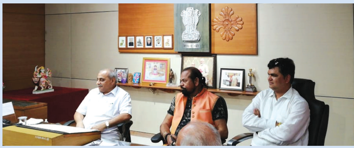
મનામણા - ભારતીય જનતા પક્ષના વડોદરા જિલ્લાના ત્રણ ધારાસભ્યોએ ગઈકાલે વ્યક્ત કરેલી વહીવટી તંત્ર સામેની નારાજગી દૂર કરવા શુક્રવારે તાબડતોબ નાયબ મુખ્યમંત્રી સાથે વાત કરવા તેડુ મોકલાવાયું હતું... જે અન્વયે નિતીભાઈ પટેલે બંને નારાજ ધારાસભ્યોની રજૂઆત સાંભળી તેમની લાગણીને યોગ્ય સમયે મુખ્યમંત્રીના આગમન બાદ ઉકેલ લવાશે એવી હેંચાધારણા આપતા નારાજગી દૂર થઈ હતી...