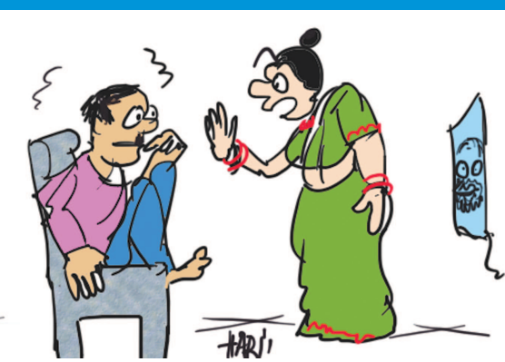
ગભરાવ નહી, પહેલી ટર્મમાં નોટબંધી કરી તેનો મતલબ એ નથી કે બીજી ટર્મ મો નોટ બંધ કરશે...