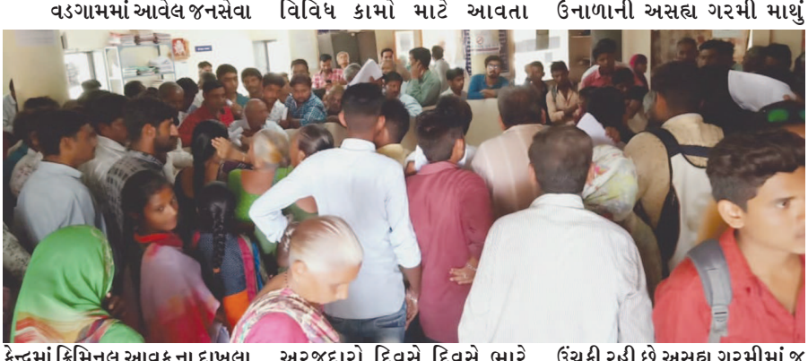
વડગામમાં આવેલા જનસેવા કેન્દ્રમાં કિમિનલ આવક ના દાખલા રેશનકાર્ડમાં સુધારા સહિતના અરજદારો દિવસે દિવસે ભારે ભીડ જામતી રહી છે એક બાજુ ઉચકી રહી છે અસહ્ય ગરમીમાં જ અરજદારોને હાલાકીઓ વેઠવાનો વારો આવ્યો છે દાખલા કઢાવવા માટે આવતા અરજદારોની સંખ્યા વધતા જનસેવા કેન્દ્રમાં અવ્યવસ્થા સર્જાતી રહી છે. અરજદારોને કલાકો સુધી દાખલા મેળવવા રાહ જોવી પડે કેટલાક અરજદારો વચ્ચે તું તું મેં મેં ના દ્રશ્યો પણ સર્જોતા રહ્યા છે ત્યારે કેટલાક અરજદારો એ જણાવ્યું હતું કે તે જવાબદાર અધિકારીઓ દ્વારા જનસેવામાં વધુ ટેમ્પરી કોમ્પ્યુટર ઓપરેટરોની વધુ વ્યવસ્થા કરવામાં આવે તો વડગામ પંથકના લોકોની સમસ્યા હલ થઈ શકે તેમ છે.

વડગામ તાલુકા મથકે આવેલા જનસેવા કેન્દ્રમાં દાખલા કઢાવવા આવતા અરજદારોની રોજ રોજ ભારે ભીડ જામતી જાય છે. જેને લઈને અરજદારોને ભારે મુશ્કેલીઓ વેઠવી પડે છે અને આખો દિવસ દાખલા મેળવવા રાહ જોયને અરજદારોને ઉભા રહેવું પડે છે. ત્યારે અરજદારોની આજે ભારે ભીડ વચ્ચે ભારે હોબાળો મચાવ્યો હતો. જનસેવા કેન્દ્રમાં વધુ કોમ્પ્યુટર ઓપરેટરોની વ્યવસ્થા કરવામાં આવે તેવી માંગ અરજદારો દ્વારા કરાઈ હતી.