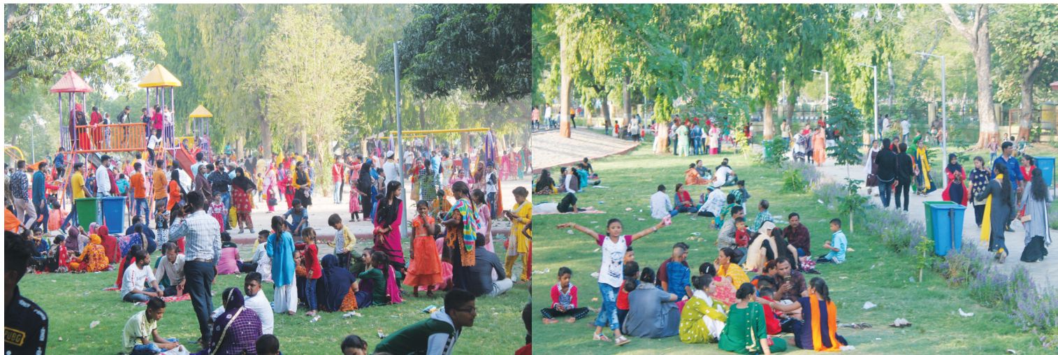
ઈન્ડિ ઉજવણી - પવિત્ર રમજાન માસ પૂર્ણ થતાં અને આકરા રોજા બાદ ચાંદ દેખાતા મુસ્લિમ બિરાદરોએ ઈન્ડિની ભવ્ય ઉજવણી કરી હતી. ગુરુવારે સાંજે મુસ્લિમ પરિવારો ગાંધીનગરના સેક્ટર-૨૮ ખાતે આવેલા બાલોદાન ખાતે ઉમટી પડ્યા હતા. અને ઈન્ડિના ઉત્સવની મજા માણી હતી. મુસ્લિમ પરિવારોએ બાલોદાન ખાતે રાઈડ્સ ઉપરાંત નાસ્તા-પાણીની મોજ માણી હતી. બાળકોએ મન મુકીને લપસણી, હિંચકા તથા અન્ય રાઈડ્સની મજા માણી હતી...