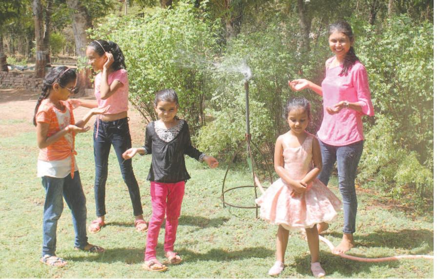
આકાશમાંથી વરસી રહેલા અંગારા અને સતત ફૂંકાતી લૂના કારણે સૌ કોઈ હેરાન પરેશાન થઈ ચુક્યા છે. બગીચાઓમાં છાંટવામાં આવતા પાણીના ફુવારામાં નહાવાનો આનંદ મેળવતા બાળકો ગરમીને દુર ભગાવી રહ્યા છે.

અગ્રણી બચાવ કામગીરી અને ત્યાંના સ્થાનિક લોકોની સલામતીના સેવા કાર્યમાં જોડાવવા આગળ આવ્યા હતા. કમલમ ખાતે વાવાઝોડા અસરગ્રસ્તોને મદદ મળે તે માટે રાઉન્ડ કલોક કન્ટ્રોલ રુમની શરૂઆત કરવામાં આવી છે. સંભવિત અસરગ્રસ્ત જિલ્લાઓમાં ભાજપના કાર્યલયો ખાતે કન્ટ્રોલ રુમની શરૂઆત કરવામાં આવી હતી. રાજકોટ મહાનગરના ભાજપ કાર્યલય ખાતે સૌરાષ્ટ્ર વિસ્તાર માટે કન્ટ્રોલ રુમ શરૂ કરવામાં આવી ચુક્યા છે.