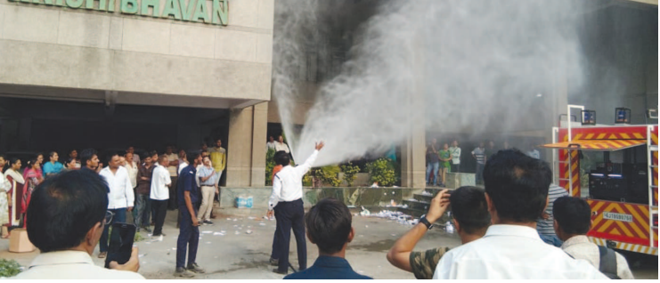
સુરતની આગની ઘટના બાદ તંત્ર સતર્ક બન્યું છે. ફાયરના સાધનોની ચકાસણી અને ડેમો-સ્ટ્રેશન યોજવામાં આવ્યા છે. કૃષિભવન ખાતે આગ ઓલવવાના સાધનોનું ડેમો-સ્ટ્રેશન યોજી તેની સમજ આપવામાં આવી હતી.

ગાંધીનગર જિલ્લામાં હાલમાં ૪૨૫૬ કુપોષિત બાળકો છે. જેમાં ૩૫૨૯ બાળકો પીળી રેખામાં અને ૭૩૬ બાળકો લાલ રેખા પર છે. આ બાળકોને કુપોષણ મુક્ત કરવા માટે જિલ્લા કલેક્ટર એસ.કે. લાંગાના માગદર્શન હેઠળ જિલ્લા વહીવટી તંત્ર દ્વારા પાનગી કંપનીઓનો સહયોગ લેવામાં આવશે. આ અભિયાનમાં સહભાગી થવા માટે પાનગી કંપનીઓ પણ ઉત્સાહભરે જોડાઈ ગઈ છે. કુપોષણ મુક્ત ગાંધીનગર જિલ્લા બનાવવા માટે આજે યોજાયેલ બેઠકમાં બાળકોને