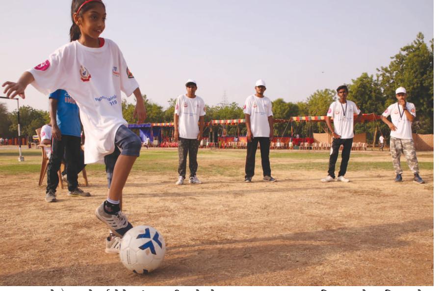
ભારતને પેરા સ્પોર્ટ્સ ક્ષેત્રે આંતરરાષ્ટ્રીય ધોરણે સુપર પાવર બનાવવાના વિઝન સાથે આદિત્ય મહેતા ફાઉન્ડેશન દ્વારા ગાંધીનગર ખાતે પેરા સ્પોર્ટ્સ ટેલેન્ટ હન્ટ ટ્રેનિંગ કેમ્પ યોજાઈ રહ્યો છે. આ કેમ્પ અંતર્ગત ૨૦૦ જેટલા અંધલીટને ૨૦૨૦ના પેરાલિમ્પિક માટે તૈયાર કરવામાં આવી રહ્યા છે. ૯મી જૂનથી આરંભાયેલો કેમ્પ ૧૪મી જૂન સુધી કાયમ રહેશે.

શ્રીકૃષ્ણપુરા ગામમાં રહેતા રઘુનાથ દાસાએ તેમના પિતાશ્રી ગોવર્ધન મઝુમદારની આજ્ઞા મેળવી અને નિત્યાનંદ પ્રભુને મળવા પાનીહાટી આવ્યા હતા. ભગવાને રઘુનાથ દાસાને આ મહાઉત્સવ ઉજવવાનો અને બધા ભક્તો ને ચીડા-દહી (દહી અને પૌઆ) પ્રસાદરૂપે વિતરણ કરવાનો આદેશ આપ્યો. રઘુનાથ દાસાએ તુરંત જ પૌઆ, દૂધ, દહી, મીઠાઈ, કેળા, ખાંડ અને બીજા ખાદ્યવસ્તુઓની ખરીદી કરવાની વ્યવસ્થા કરી. પૌઆને દૂધમાં પલાળવામાં આવ્યા હતા જેમાંથી અડધા ભાગને દહી, ખાંડ અને કેળા સાથે મિશ્રિત કરવામાં આવ્યા હતા જ્યારે બાકી રહેલ અડધા ભાગમાં ઘઉં કરેલ દૂધ, શુધ્ધ ઘી અને કપૂર મિશ્રિત કરી સ્વાદિષ્ટ બનાવવામાં આવ્યા હતા. દરેક ભક્તને બે માટીના કોડીયા આપવામાં આવ્યા જેમાંથી એકમાં પૌઆ-દહી અને બીજામાં પૌઆ- ઘઉં કરેલ દૂધને પ્રસાદરૂપે વિતરવામાં આવ્યું હતું. આ અદભૂત પ્રસંગની યાદગીરીરૂપે દર વર્ષે "ચિડા-દહી" મહોત્સવ ઉજવવામાં આવે છે. આ દિવસે યાત્રાળુઓ "ચિડા-દહી" ઉત્સવની ઉજવણી કરવા પાનીહાટી ગામની મુલાકાત લે છે. દર વર્ષે હરેકૃષ્ણ મંદિર, ભાડજ આ ઉત્સવની ઉજવણી કરે છે જેમાં પાલકી ઉત્સવ, ભગવાન શ્રી શ્રી નિતાઈ ગોરંગને અભિષેક અને નૌકા વિહાર તથા ચિડા-દહી મહાપ્રસાદનું વિતરણ કરીને કરવામાં આવે છે. વિવિધ પ્રકારના સ્વાદિષ્ટ વ્યંજનો બનાવીને ભગવાનને અર્પણ કરાય છે.