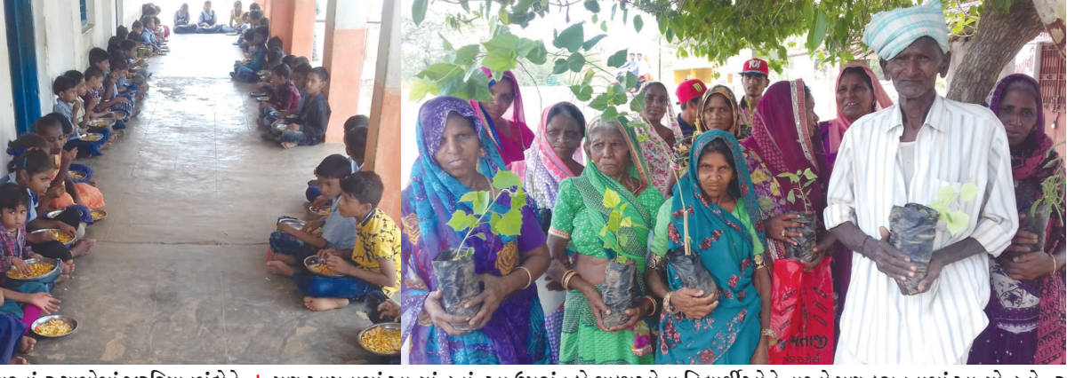
પણ આપવામાં આવ્યાં હતાં. આ ઉપરાંત બે શાળાઓના વિદ્યાર્થીઓને નાસ્તો પણ કરાવવામાં આવ્યો હતો, ૩ આંગણવાડીનાં બાળકોને બિસ્કીટ અને વસ્ત્રો ભેટ આપવામાં આવ્યાં હતાં.