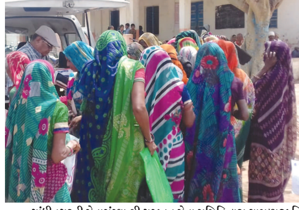
ગાંધીનગરની સેવાસંસ્થા શ્રી ગજાનન સેવા સમિતિ દ્વારા શામળાજી વિસ્તારનાં ૩ ગામોમાં જરૂરિયાતમંદોને ૩ કિગ્રા ચોખાની ૧૨૬ કિટનું વિતરણ કરવામાં આવ્યું હતું. તેમને દૂધીનાં બીજ, ચંહાનાં પેક, સાબુ અને પગરખાં