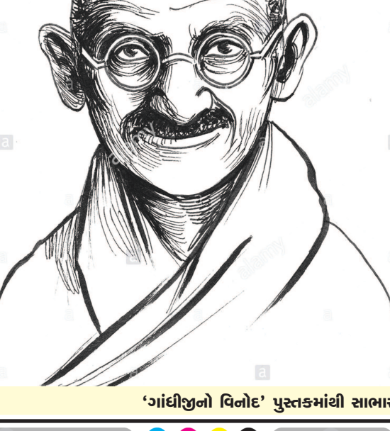
'ગાંધીજીનો વિનોદ' પુસ્તકમાંથી સાભાર

૧૪૫ - મોટા શરીરને મોટો ચમચો જાણીતા પત્રકાર શ્રી લુઈ ફિશર ગાંધીજીને મળવા આવ્યા ત્યારે તેમનો ભોજનનો સમય હતો. ફિશરનું શરીર સ્વૂળ હતું. ગાંધીજીએ તેમને જમવાનું કહ્યું. ફિશરે હા પાડી. ભોજનની વ્યવસ્થા થઈ ગઈ. થાળીમાં નાના ચમચાની જગ્યાએ મોટો ચમચો રખાવ્યો હતો. મોટો ચમચો જોઈ ફિશરને આશ્ચર્ય થયું. ચમચો હાથમાં લઈ તેમણે ગાંધીજી તરફ પ્રસ્થાવ કરતા હોય તેમ જોયું! ગાંધીજીએ સ્પર્ધાકરણ કર્યું કે, 'અરે ભાઈ, તમારું શરીર જોતાં આ ચમચાથી જમવામાં વધુ સરળતા રહેશે.' ફિશરનું આશ્ચર્ય સ્મિતમાં પલટાઈ ગયું.