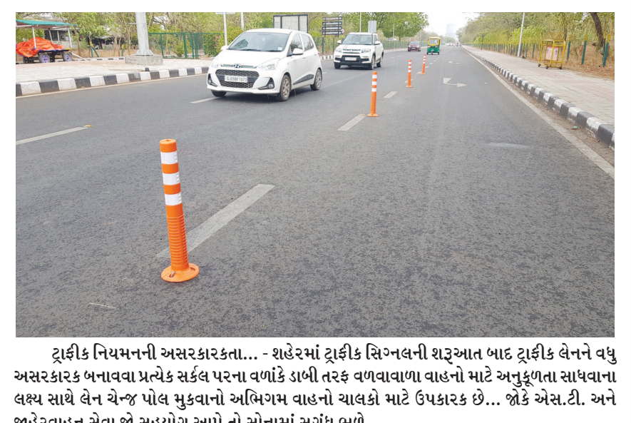
ટ્રાફિક નિયમનની અસરકારકતા... - શહેરમાં ટ્રાફિક સિગ્નલની શરૂઆત બાદ ટ્રાફિક લેનને વધુ અસરકારક બનાવવા પ્રત્યેક સર્કલ પરના વળાંકે ડાબી તરફ વળવાવાળા વાહનો માટે અનુકૂળતા સાધવાના લક્ષ્ય સાથે લેન ચેન્જ પોલ મુકવાનો અભિગમ વાહનો ચાલકો માટે ઉપકારક છે... જો કે એસ.ટી. અને જાહેરવાહન સેવા જો સહયોગ આપે તો સોનામાં સુગંધ ભળે...

આકાશમાં વરસાદી વાદળોનો ઘેરાવો રહ્યો હતો. દિવસ દરમિયાન તડકી છાયડી વચ્ચે બપોરના સમયે ઝરમર વરસાદ પણ વરસ્યો હતો. બીજાતરફ વાતાવરણમાં બફારાનું પ્રમાણ આજે પણ વધુ રહેતા નગરજનો ગરમીથી અકળાયા હતા. જો કે બપોરે વરસાદ છાંટણા વરસાવી જતા થોડી ઠંડક પ્રસરી હતી પરંતુ મેઘરાજા મનમુકીને વરસ્યા ન હતા. જ્યારે ગરમીનું પ્રમાણ પણ ગઈકાલની સાપેક્ષમાં વધુ રહ્યું હતું. ગરમીનો પારો ૪ ડીગ્રી રહ્યો હતો. જ્યારે લઘુત્તમ તાપમાન પણ ૨૭ ડીગ્રી નોંધાયું હતું. વરસાદી વાતાવરણ વચ્ચે વાતાવરણમાં ભેજનું પ્રમાણ વધુ રહેતા નગરજનો બફારાના લીધે પરસેવે ભીંજાયા હતા. ગઈકાલે પણ વરસાદી ઝાપટાના લીધે વાતાવરણમાં ઠંળી ઠંડક પ્રસરી