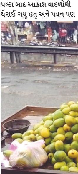
બંધ થઈ ગયો હતો. જેના લીધે વાતાવરણમાં ભેજનું પ્રમાણ વધી

હિંમતનગર, તા. ૧૭ વાયુ વાવાઝોડાએ રિવર્સ ટર્ન લઈને કચ્છને ધમરોળવાનું શરૂ કર્યું છે ત્યારે તેની અસરોને લીધે સાંમવારે સાબરકાંઠામાં બદલાયેલા વાતાવરણ બાદ છુટોછવાયો વરસાદ પડ્યો હતો. જોકે કેટલાક સ્થળે વરસાદ ન થતા ત્યાં બાફ અને ઉકળાટનો અનુભવ વધુ થવા પામ્યો હતો. સાંમવારે હિંમતનગરની આસપાસ તથા જિલ્લાના અન્ય સ્થળે થયેલા ઝાપટાને લીધે લોકોમાં વધુ વરસાદ થવાની આશા બંધાઈ છે. ડિઝાસ્ટર વિભાગના જણાવવા મુજબ વાયુ વાવાઝોડાએ રિવર્સ ટર્ન લઈને કચ્છના કેટલાક વિસ્તારોને સ્પર્શી આગળ વધી રહ્યું છે. ત્યારે તેના લીધે સાબરકાંઠામાં સાંમવારે સવારથી જ વાતાવરણમાં આવેલા