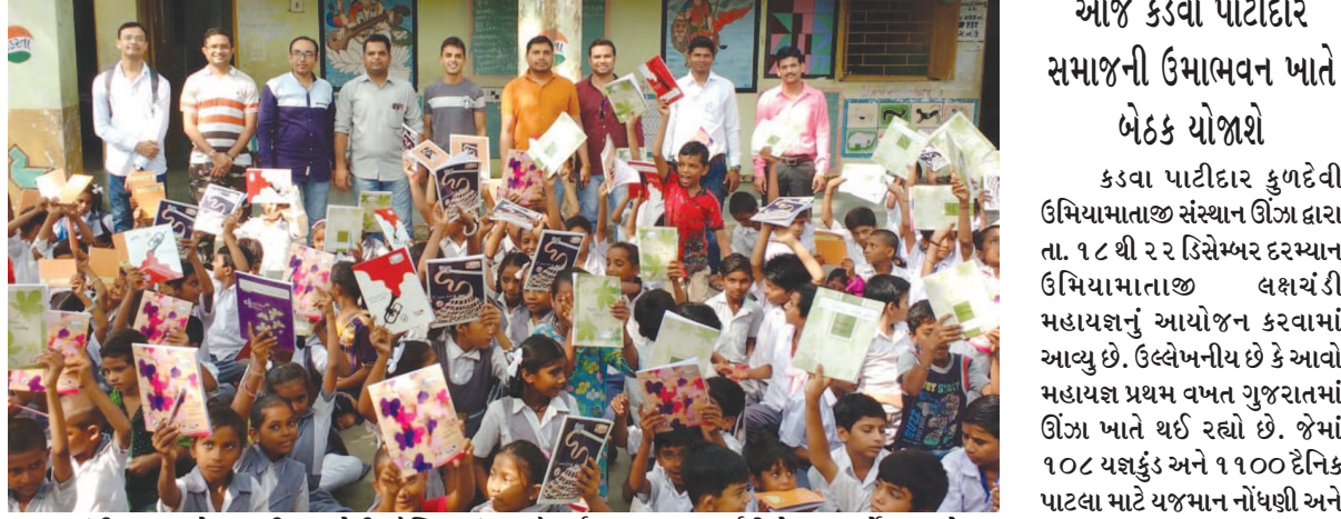
ગાંધીનગરના સેવાભાવી યુવાનોની સ્વેચ્છિક સંસ્થા ચોહાઈ ગ્રુપ દ્વારા દર વર્ષની જેમ આ વર્ષે પણ શહેરના જરૂરિયાતમંદ વર્ગના બાળકોને વિનામૂલ્યે ચોપડા, નોટબુક, પેન્સિલ વગેરેનું વિતરણ કરવામાં આવ્યું હતું. આ કાર્યક્રમ અંતર્ગત ગ્રુપ દ્વારા શહેરના સેક્ટર ૨, ૬, ૧૩, ૧૫ અને ૧૬ની સરકારી પ્રાથમિક શાળાઓના આશરે ૪૦૦થી વધુ બાળકોને આવી રી લેવાયા હતા.