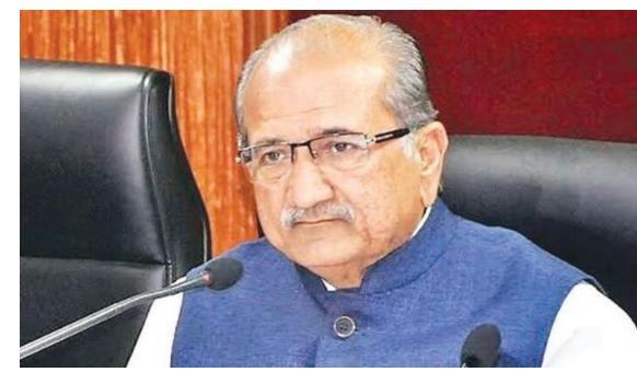
ઉપયોગ થાય તે શક્ય નથી. બાળક ભણવાના સમય દરમિયાન ચાર થી પાંચ કલાક પડતી છે. ઉપરાંત ઘણા વિદ્યાર્થીઓ શાળાએ આવવા જવા માટે અપડાઉન કરે છે

ગુજરાતના શિક્ષણ મંત્રી ભૂપેન્દ્રસિંહ યુડાસમાએ ગાંધીનગર સમાચારની મુલાકાત લેતા જણાવ્યું હતું કે, તેઓ દરેક બાળકને પોતાનું બાળક માનીને જ આગળનો કોર્ષ પણ નિર્ણય લેશે. અનલોક-૨ના બીજા અઠવાડિયા બાદ શાળાને ખોલવી કે નહિ તે અંગેનો નિર્ણય લેવાશે.