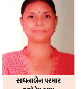
સાંઘનાબેન પરમાર લાયએસે કલબ