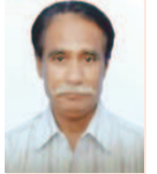
છત્રસિંહ નરેન્દ્રસિંહ ચૌહાણ