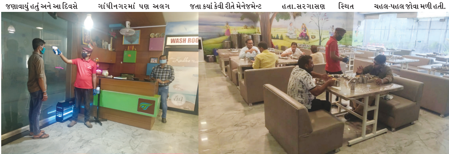
નગરમાં રોજ કરતા વધુ ચલક પલક જોવા મળી હતી. નવા માહોલ દેખાયો હતો. રેસ્ટોરન્ટ અને હોટલ આજથી ખુલી થશે તે જાણવા ખાસ યુવાનો આતુર જણાયા

ગાંધીનગર, તા.૮ નગરમાં અનલોક-૧ની શરૂઆત થઈ ગઈ છે ત્યારે નગરના અમુક મંદિર અને રેસ્ટોરન્ટ હવે ખુલી ગયા છે. ઉપરાંત મોલ તો યોગ્ય ડિસ્ટન્સ સાથે ખુલ્યા જ હતા. રેસ્ટોરન્ટમાં ટેક ઈન ટેક અવે ની સુવિધા શરૂ થઈ છે. સાથે સરગાસણ સ્થિત રાધે થાળ ડાઈનિંગ ની સુવિધા સાથે સજજ છે. નગરજનો ૮ જૂન એટલે કે અનલોક ૧ ની કાગડોળે રાહ જોઈ રહ્યા હતા. આ દિવસે મુખ્ય ધંધા રોજગાર અમુક શરતો સાથે ખુલશે તેમ સરકાર દ્વારા