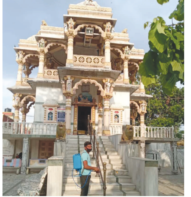
કરીને મંદિર પરિસર છોડી દેવાની" નમ્ર વિનંતી" જેવા સૂચનોનો સમાવેશ થાય છે. મંદિરના સંચાલક મંડળ

સમગ્ર વિશ્વ ને બાન માં લઈ હાહાકાર મચાવનાર કોરોના વાઈરસના સંક્રમણના ખોક ને કારણે વિશ્વભરના નાના/મોટા દેવ મંદિરો લગભગ અડી માસથી વધુ સમયથી બંધ છે. સાબરકાંઠાના તલોદના દેવ મંદિરો પણ આ સમય ગાળામાં બંધ રાખવાની જે તે ટ્રસ્ટી મંડળોને ફરજ પડી હતી. જે અન્વયે જડબેસલાક બંધ રહેલા તલોદના શ્રી કૃષ્ણ મંદિર, શ્રી એકિંલ ગેશ્વર મહાદેવજીનું શિવાલય, શ્રી નાથજીની હવેલી તથા શ્રી અંબાજી મંદિર તથા જેન દેરાસરો આજે સોમવારથી રાખેતા મુજબ ખુલી ગયા છે.