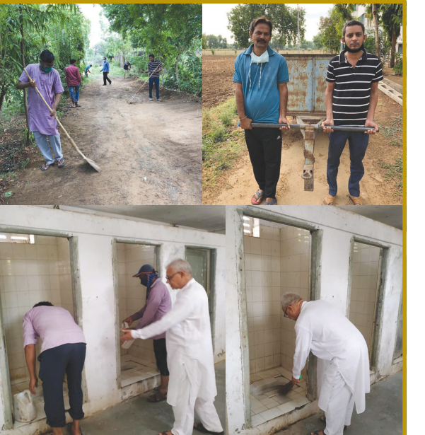
મહાદેવ દેસાઈ ગ્રામ સેવા સંકુલ-સાદરામાં સમૂહ સફાઈ યજ્ઞ હાથ ધરાવ્યો હતો. જેમાં સંકુલ પ્રાંગણ, હિંચકા બાગ, ગોણ દરવાજા સુધીનો રસ્તો, કસ્તુરબા આહાર ગુહનો રસ્તો, ઓષધિ બાગ, ગુજરાત વિદ્યાપીઠ શતાબ્દી સ્મૃતિ બાગની સફાઈ કરાવામાં આવી હતી.

ગાંધીનગર, તા. ૯ રાજ્ય મધ્યસ્થ ગ્રંથાલય અત્યારે કોવિડ-૧૯ની વ્યાપક મહામારીને ધ્યાનમાં રાખીને સરકારશ્રીએ કરેલ જાહેરાત મુજબ કાર્યરત થઈ ગયું છે. તે અનુસાર જે વાચકમિત્રોનું સભ્યપદ તા. ૩૧/૦૩/૨૦૨૦ના રોજ સમાપ્ત થઈ ગયું છે તેને રિન્યુ કરવાની કામગીરી અત્યારે ચાલુ છે. સભ્યપદ રિન્યુ કરાવવા માટે આધારકાર્ડની કોપી+૧ ફોટોગ્રાફ સાથે લઈને આવવું તથા જેમણે સભ્યપદ રિન્યુ કરાવ્યું હોય તે વાચકમિત્રો પુસ્તકો ઈસ્યુ કરાવી શકે છે. જે વાચકોએ લોકડાઉન પહેલાં પુસ્તકો ઈસ્યુ કરાવ્યા હોય, અને લોકડાઉનના કારણે પુસ્તકો પરત કરવાની તારીખ વીતી ગઈ હોય તેમની પાસેથી નિયમાનુસાર ડંડની થતી રકમની વસૂલાત કરવાની રહેશે નહીં. તદ્દરપરાંત દૈનિકપત્રો તથા સામાયિકોનો વિભાગ પણ જાહેર વાચકોના વાંચન અર્થે ખુલ્લો છે. તેઓ ગ્રંથાલયમાં બેસીને તેનું વાંચન કરી શકે છે. અહીં બેસીને સ્વયંચાલક પરિશાની તૈયારી કરતાં વિદ્યાર્થીઓની મોટી ભીડ એકત્ર થાય તો કોરોનાની સ્થિતિને લઈને સામાજિક અંતર જળવાય નહીં તેને અનુલક્ષીને હમણાં ચાલુ કર્યા નથી. એ સિવાય ખાસ અગત્યના કામને બાદ કરતાં વાચક સિવાયના અન્ય મુલાકાતીઓ માટે પ્રવેશ સંપૂર્ણ બંધ છે.